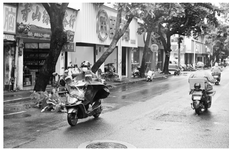
广东省气象台消息,今年第1号台风“蝴蝶”的中心已于6月14日12时30分前后在广东省雷州市西部沿海再次登陆,登陆时减弱为强热带风暴级,中心附近最大风力11级(30米/秒),中心最低气压980百帕。图为6月14日,在广东省湛江市,市民冒雨骑行。