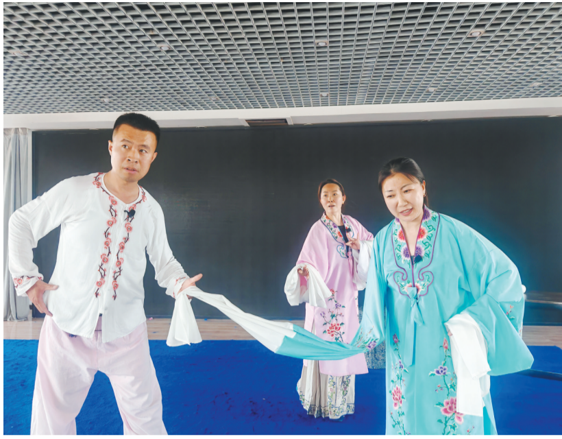
6月9日,朝阳市评剧团排演的新编大型传统评剧《慕容传奇》结束打磨,即将正式亮相。

6月9日,朝阳市评剧团排练厅内,风扇“呼呼”地吹着,板胡和唢呐的高亢驱走午后困倦,演员们的唱腔时而悲痛,时而紧迫……新编大型传统评剧《慕容传奇》的打磨已经进入最后一天。这部剧是2024年度全省文联系统文艺精品扶持作品,2025年朝阳市戏曲周系列活动也紧紧围绕其展开。一家县级评剧团,为何能承担如此重量级大戏,又是如何将传统艺术扎根在辽西土地上的?今天,请跟随记者一起探索这支基层艺术团“长红”的原因。