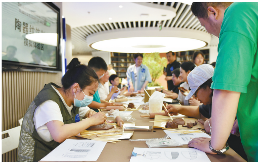
在沈阳公众考古活动季(第三季)上,参与者亲手尝试古代纹饰绘制。

6月15日,辽博将推出两场讲座,观众既可预约现场观看,也可通过抖音、微信视频号在线观看。其中一场是浙江省博物馆研究馆员蔡琴结合正在辽博展出的“漫步美中——古罗马时期女性主题文物展”,带领大家一起“从文物管窥汉代女子的生活图景”;另一场是敦煌研究院文物数字化研究所副所长丁小胜为观众带来的《数字敦煌:多学科协同下的文化遗产科技保护创新实践》。“博谈雅集”也将推出系列专场活动。观众可受邀走进“满族民俗展”,聆听文物背后的故事,体验传统