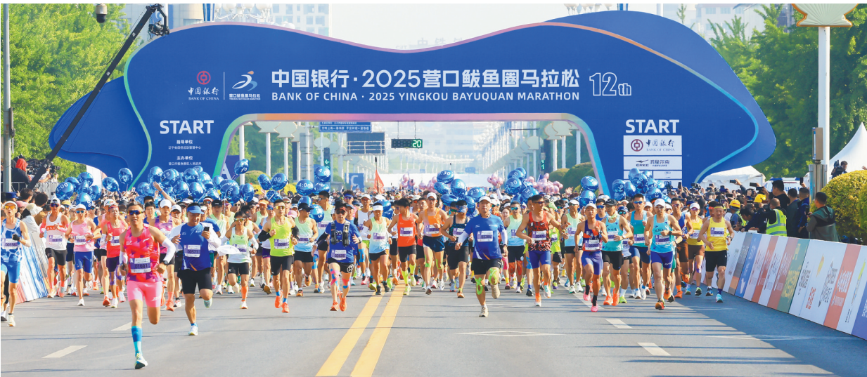
中行辽宁省分行冠名的2025营口鲅鱼圈马拉松比赛现场。

助力“振兴杯”，赋能冰雪经济发展。第三届“振兴杯”沈阳青少年冰球邀请赛会聚来自中国、加拿大、白俄罗斯、泰国、韩国等国家的65支球队，角逐近200场。中行沈阳分行全力做好金融服务保障，完善全市网点、自助设备、外币代兑机构组成的