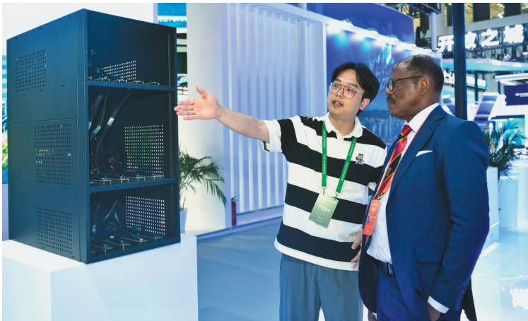
6月11日，以“共建创新之路，同促合作发展——携手构建‘一带一路’科技共同体”为主题的第二届“一带一路”科技交流大会在四川成都开幕。据了解，大会总体活动包括重要活动、主题活动、特色活动、圆桌会议、技术对接5大板块。图为参展商在向外宾介绍展出的高性能GPU服务器。