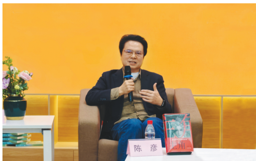
陈彦在“文学与灵魂的相遇”读者见面会上,与沈阳读者分享心得体会。

为,一是生活,二是时代,并且要打通生活与时代的关系。对于文学作品,一千个作者有一千种写法,但归根到底,必须要有深厚的生活,能否在生活中“压榨”出别人不曾发现的东西,决定了作家创作的深度和广度。作家要找到最熟知的生活,将那些毛茸茸的细节与大时代紧密相连。