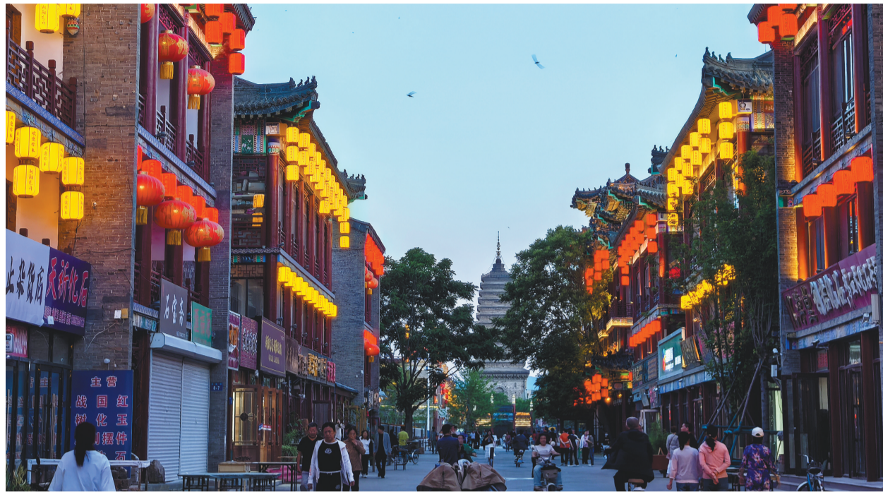
连接北塔与南塔的慕容街,已成为朝阳文旅重要地标。

辽阳,有着“东北第一城”的美誉,是东北地区建置最早的城市,其历史可追溯至战国时期燕国设立的辽东郡。自那时起,辽阳便成为东北地区政治、经济、文化的中心之一。汉魏壁画墓群用精美的壁画描绘了当时人们的生活场景、神话传说,为研究汉代社会提供了珍贵资料;广佑寺历史悠久,其大雄宝殿是世界最大的木质结构佛教殿堂;东京城遗址、燕州城山城等见证了这座城市在不同朝代的辉煌。