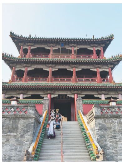
在沈阳故宫的凤凰楼,游客们定格下属于自己的古风记忆。