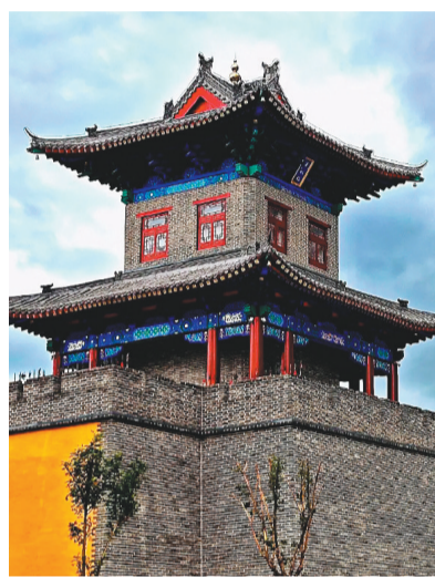
平湖楼是辽阳的标志性建筑。