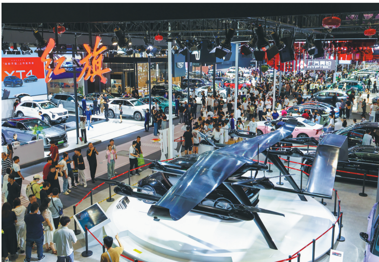
观众在深圳举办的2025粤港澳大湾区车展的红旗汽车展台观看“天擎1号”飞行汽车(2025年5月31日摄)。

中汽协的倡议指出，无序“价格战”加剧恶性竞争，将进一步挤压企业利润空间，进而影响产品质量和售后服务保障，不仅阻碍行业自身健康发展，也将危害消费者权益，并带来安全