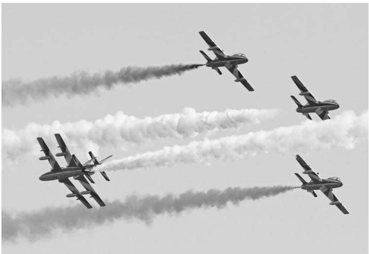
6月1日，意大利“三色箭”飞行表演队在意大利罗马附近的拉迪斯波利举行的航展上表演。