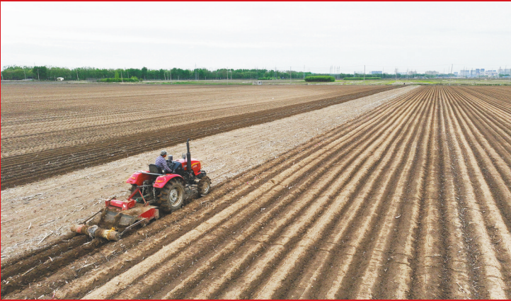
铁岭市铁岭县凡河镇农户们抢抓晴好天气翻整土地、铺设地膜、播种玉米、水稻育苗、苗圃育苗,水田灌溉,为全年农业丰收奠定基础。