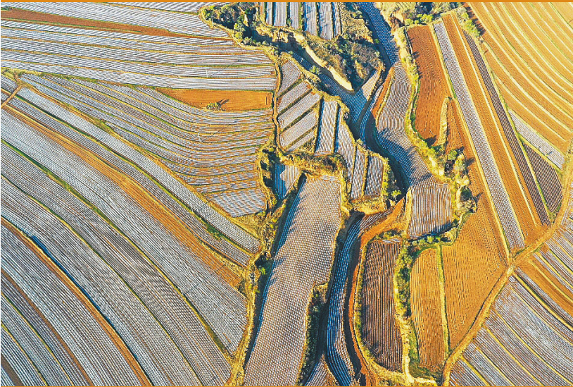
在朝阳市建平县罗福沟乡广阔的田野上,田垄里的地膜蜿蜒如玉带般镶嵌在大地之上,交相辉映出一幅幅美丽的大地画卷。