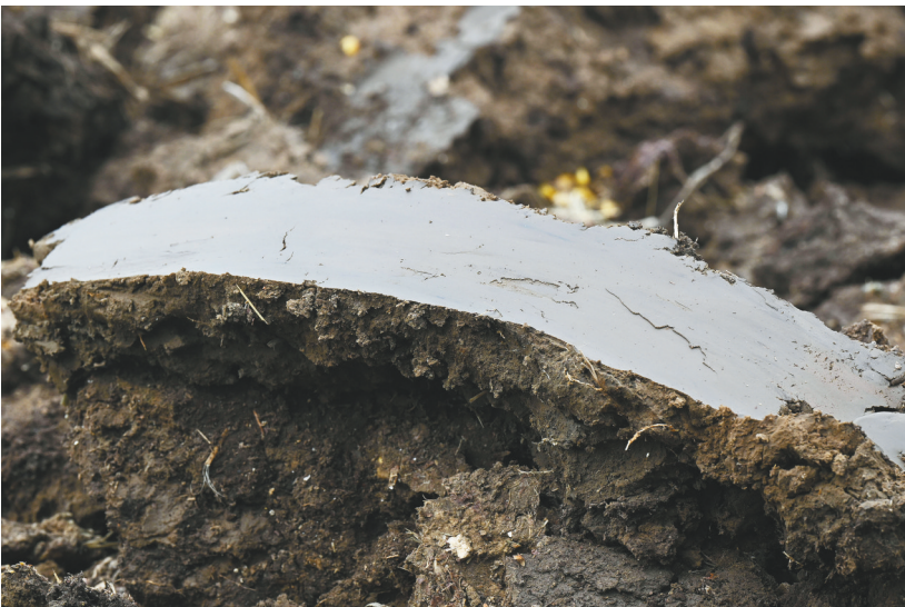
在铁岭市昌图县老城镇,“铁牛”驰骋在示范田里进行作业,所过之处,肥沃油亮的黑土散发出醉人的芳香。

黄是沃土沉淀的丰饶底色,是种子在菜畦间新绿泛黄的生长韵律,是春风里舒展的对秋收的无限期许。