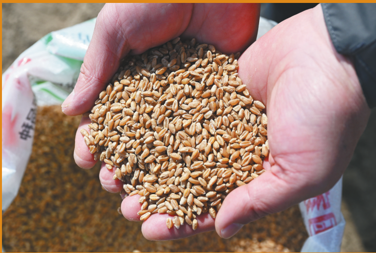
阜新市彰武县兴隆山镇老虎村,即将下田开播的“辽春18”小麦种子。