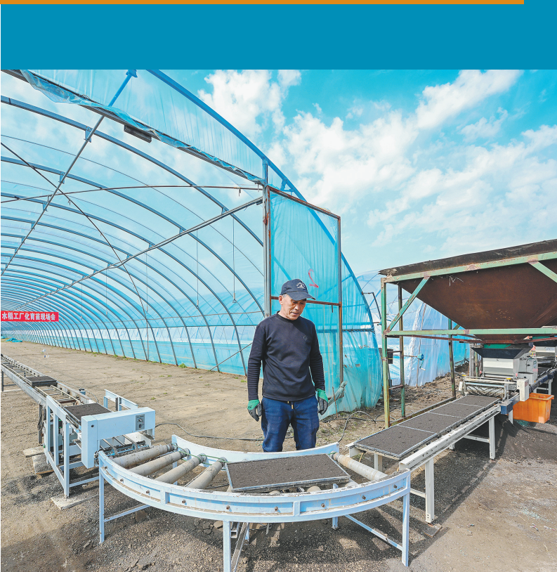
沈阳市苏家屯区来胜堡村,水稻工厂化育苗实现机械自动化作业,一盘盘拌种后的秧盘经“流水线”传送至大棚里。

本版制图 隋文锋