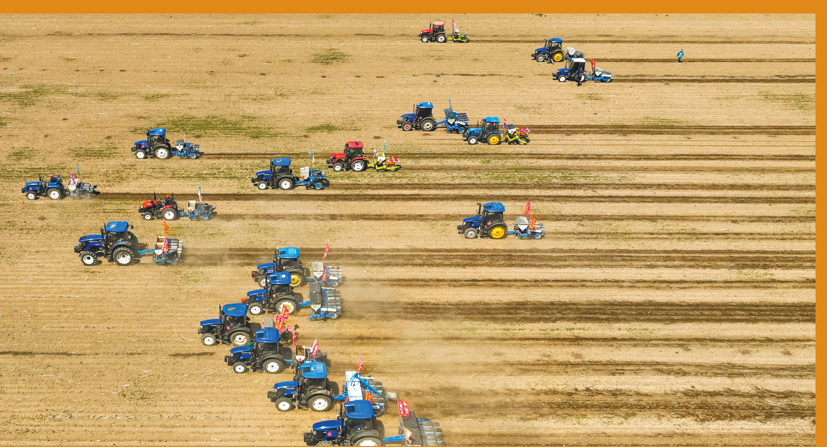
鞍山海城市耿庄镇土台村,海城万盈农业科技有限公司的机手们,驾驶着33台播种机在中试田进行一年一度的春耕“拉练会”。