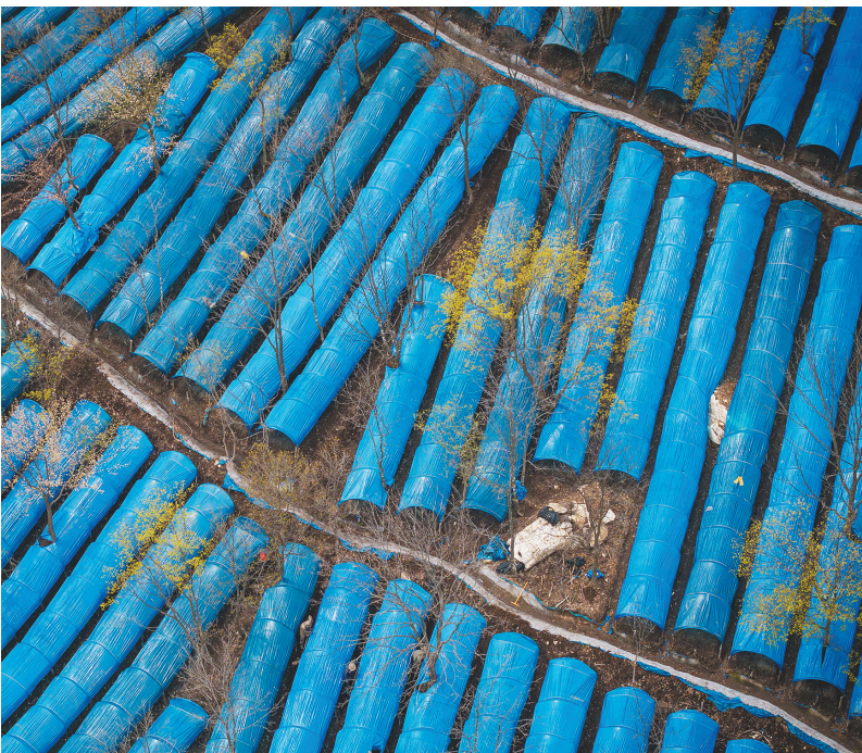
营口盖州市万福镇的营口天泽园农场 2100 亩仿森林环境中草药种植大棚。