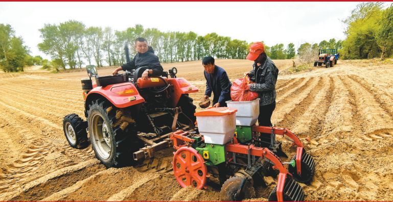
铁岭市昌图县三江口镇刘塘坊村村民抢抓晴好天气,全面展开花生种植工作,为夺取今年的丰产丰收播下希望的种子。