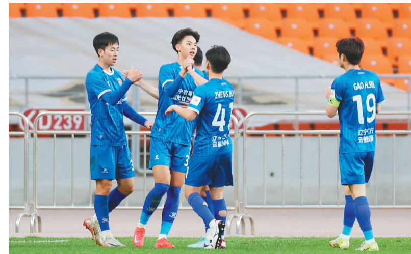
4月18日,辽宁铁人队球员在比赛中庆祝得分。

主场比赛4天之后,4月26日15时30分,辽宁铁人队将客场对阵青岛红狮队,这相当考验球队的体能。由于早早陷入保级泥潭,青岛红狮队此役必将全力一搏,辽宁铁人队不能轻视对手。在一周双赛的情况下,铁人队如何排兵布阵将是一门学问。尤其是4月22日的比赛,如果辽宁铁人队能够以“低能耗”的模式全取3分,将大大减轻客场比赛的难度。