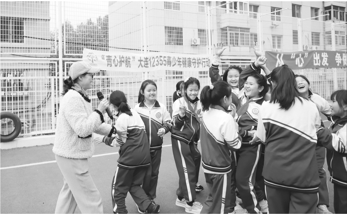
辽宁(大连)12355青少年服务台组织专家志愿者到西岗区水仙小学开展“青心护航”健康守护系列活动,运用心理行为训练技术,激发学生积极健康情绪。