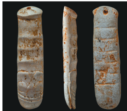
红山文化时期蛇状玉耳坠。

出现双人首共一蛇身俑，唐朝时达到鼎盛，并一直沿用至两宋。北齐至唐，双人首蛇身俑主要见于北方地区，多为陶胎或高岭土胎，极个别为瓷质，部分表面施有化妆土。双人首面目基本相同，有的头戴兜住下颌的尖顶帽，或者梳有尖发髻，兽耳，上肢呈兽蹄形伏于地，身体部分相连。双人首蛇身俑起着驱妖逐魔、镇墓避邪的作用。展览中，就有出自我省朝阳地区唐代墓葬中的“双人首蛇身俑”。