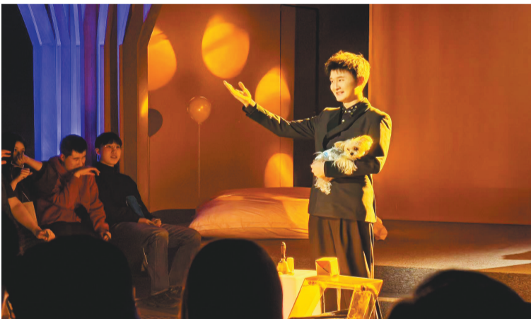
魔术剧《无光》将听觉魔术、嗅觉魔术、触觉魔术、味觉魔术等进行巧妙融合，为视障者呈现了一场能够“观看”的魔术表演。

于视障者来说很直观，感谢咱们团队用一种新视角关注视障者的生活，让黑暗中的我们体验到了一种