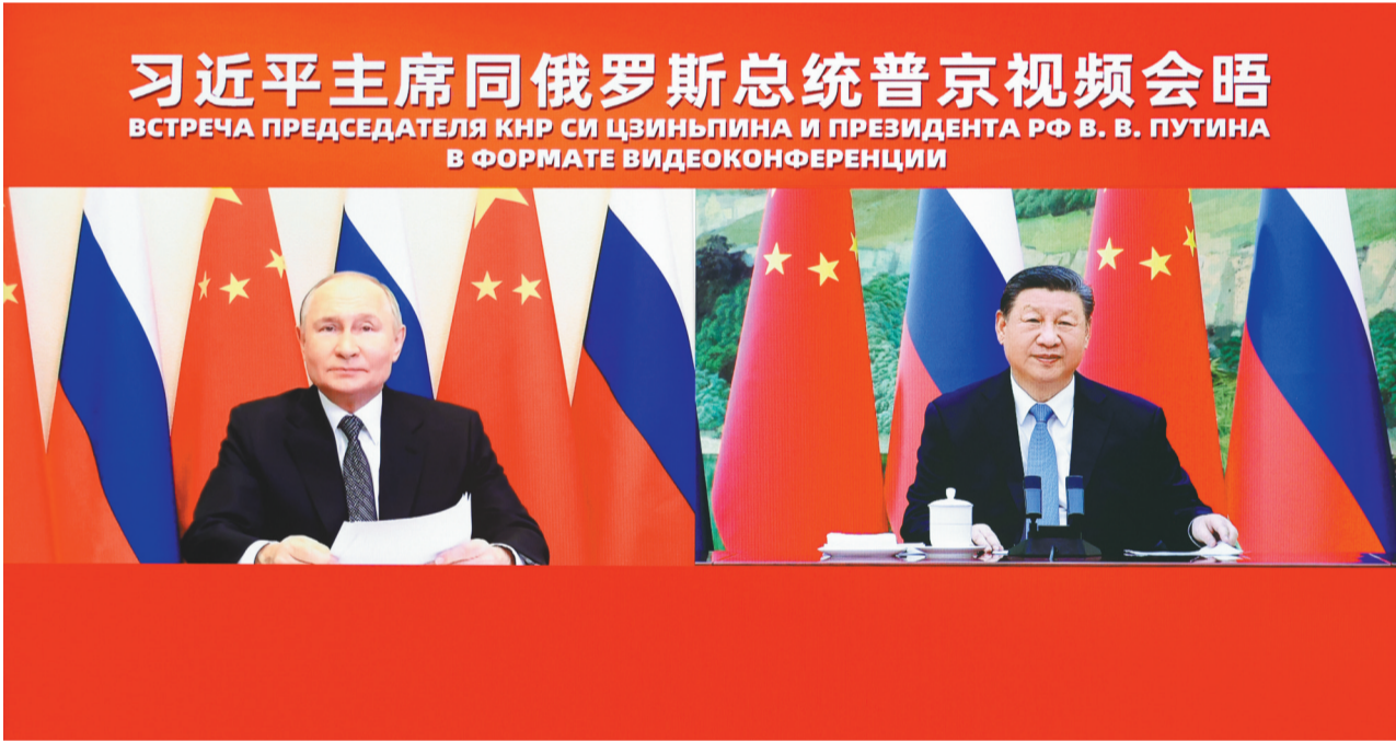
1月21日下午，国家主席习近平在北京人民大会堂同俄罗斯总统普京举行视频会晤。新华社记者 刘彬 摄

新华社北京1月21日电（记者董雪）1月21日下午，国家主席习近平在北京人民大会堂同俄罗斯总统普京举行视频会晤。 两国元首互致新年祝福。习近平指出，再过几天就是中国春节，很高兴在这一辞旧迎新的时刻同总统先生视频会晤，祝愿新的一年中俄关系红红火火。普京表示，很高兴在新年伊始同习近平主席视频交流，祝愿习近平主席和中国人民新春快乐，万事如意！ 习近平指出，2024年，我们3次会晤，达成许多重要共识。两国隆重庆祝建交75周年，以永久睦邻友好、全面战略协作、互利合作共赢为精神内核的中俄关系不断焕发新的活力。中俄文化年精彩纷呈，务实合作稳中有进，双边贸易额保持增长势头，在联合国、上海合作组织、金砖国家等多边平台密切协作，为全球治理体系改革和建