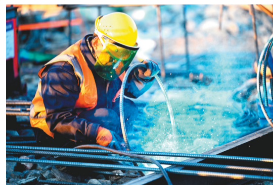
施工人员不畏严寒奋战在沈阳王家湾十五冬冰上运动中心项目建设现场。