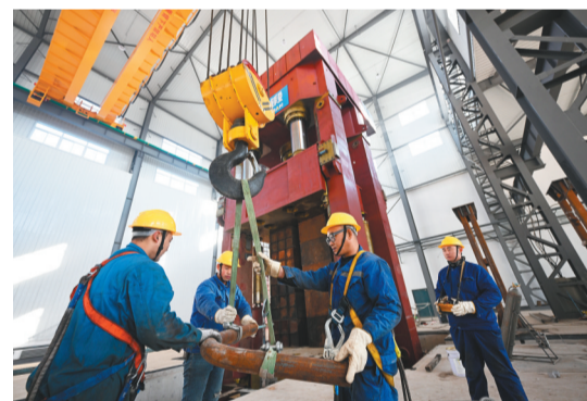
辽宁五一八内燃机配件有限公司大型锻轴曲轴生产线建设项目已进入主设备安装调试阶段。