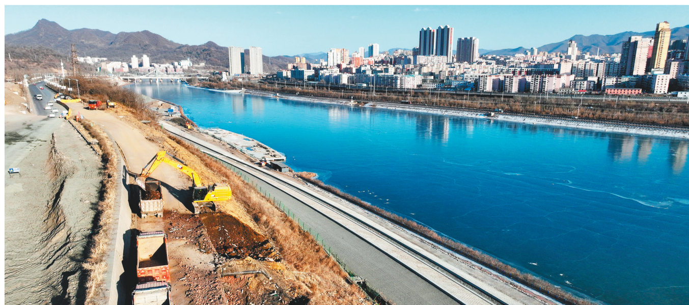
本溪市太子河城市段河道治理工程的实施将大幅提高太子河防洪能力，工程目前已进入收尾阶段。

①②③④总投资837亿元的华锦阿美精细化工及原料工程项目，32套装置全部开工建设，工程总体进度已完成55%。