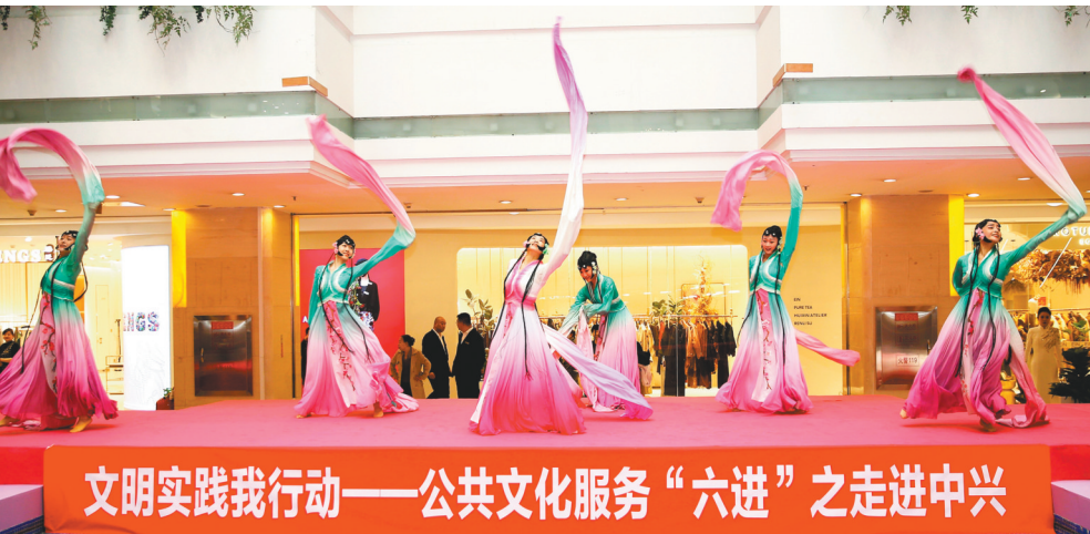
“文明实践我行动——公共文化服务‘六进’之走进中兴”文艺快闪在中兴商业上演。

今年以来,面对市场竞争持续加剧与消费需求的多元变化,方大集团中兴商业通过品牌矩阵优化、会员体系建设和赛道经济等多维创新驱动,展现出高质量发展的强劲动力,有效提升市场竞争力与顾客满意度。