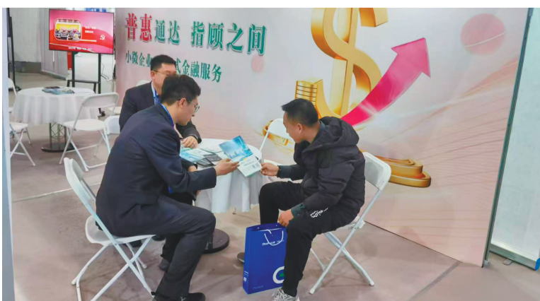
农行高新支行员工在2024国际数字和软件服务交易会现场宣传小微企业融资协调政策。

连日来,在大连旅顺口区,农行旅顺支行组建团队,走进旅顺三涧堡街道东泥河村和许家窑村,宣传农行普惠贷款、农户贷款产品及政策,与当地村民面对面沟通交流。目前,旅顺支行已累计走访街道、村镇30个,开展金融宣讲40余次,为小微企业发放贷款7647万元。