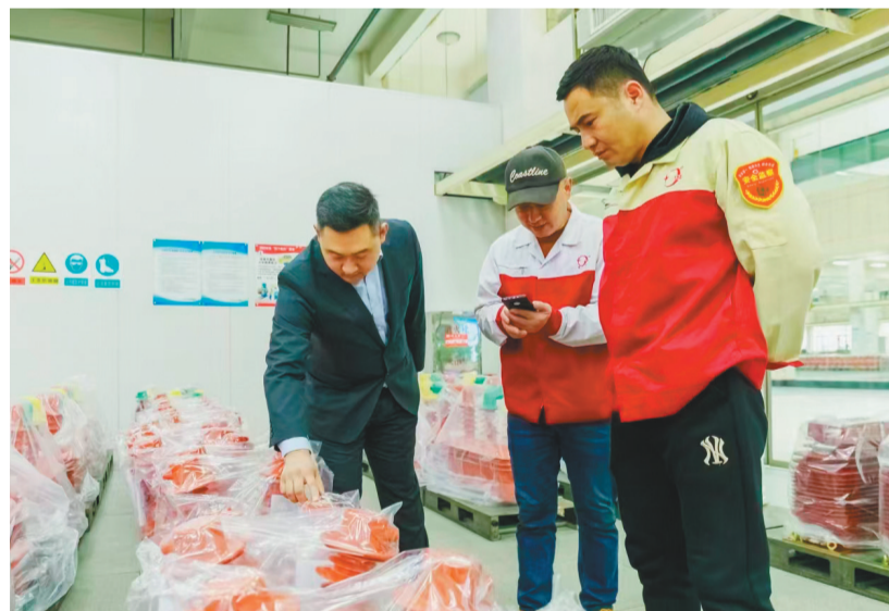
普兰店支行客户经理(左一)走访企业开展贷后调查。