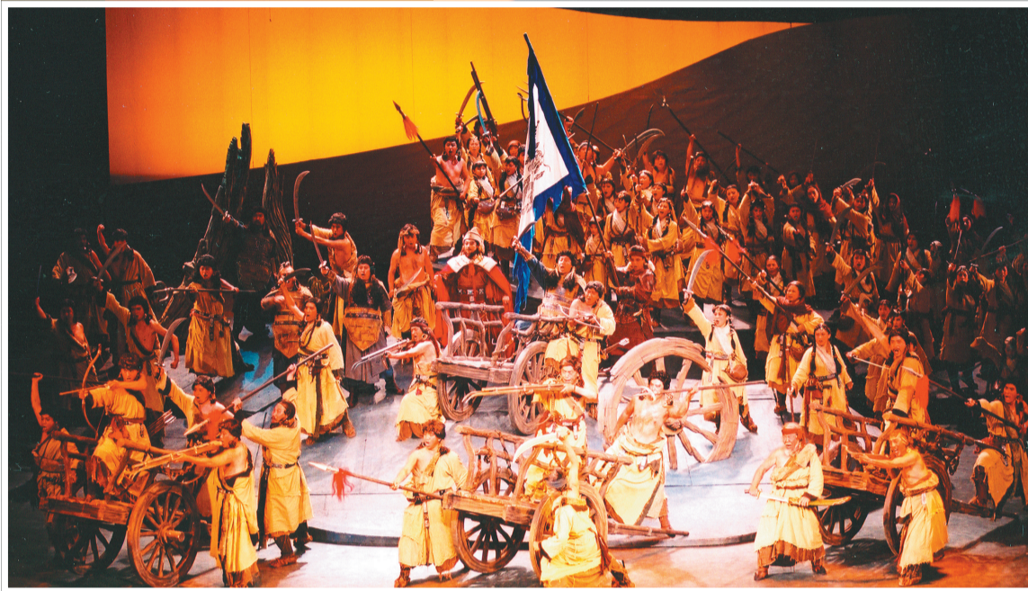
在全体工作人员的精心打磨下，《苍原》呈现出恢宏气势，图中一幕为部族用勒勒车围成圆阵，准备抵御敌人的进攻。