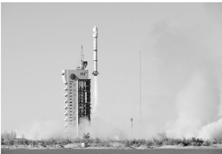
11月9日11时39分,我国在酒泉卫星发射中心使用长征二号丙运载火箭,成功将航天宏图PIESAT-2 01~04星发射升空,卫星顺利进入预定轨道,发射任务获得圆满成功。