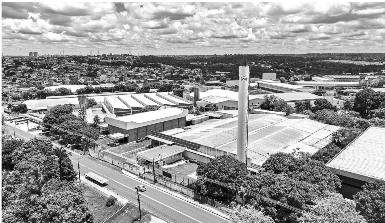
这是2024年3月12日在巴西亚马孙州马瑙斯拍摄的比亚迪电池工厂(无人机照片)。比亚迪巴西分公司成立于2014年,除了在巴西市场销售电动汽车、货车、卡车和乘用车之外,该公司还在巴西设立了纯电动大巴底盘厂、太阳能板厂、电池工厂等以满足当地市场需求。

从提出树立“亚太命运共同体意识”,到倡导共建“互信、包容、合作、共赢的亚太伙伴关系”,从勾画“全方位互联互通蓝图”,到维护全球供应链产业链畅通……2013年以来,习近平主席出席或主持历次亚太经合组织领导人非正式会议并发表重要讲话,为推动区域合作、构建亚太命运共同体提