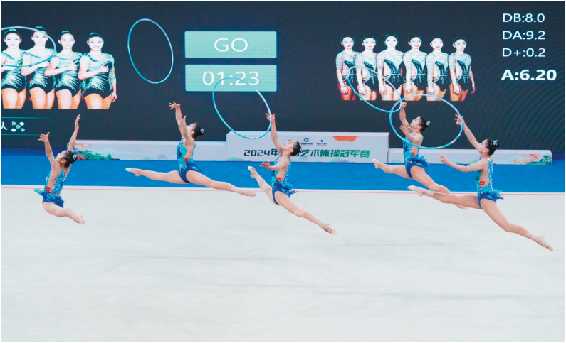
10月23日,2024年全国艺术体操冠军赛成年集体5圈决赛在重庆举行,辽宁金满星队以32.45分的总成绩获得冠军。图为辽宁金满星队在5圈决赛中。