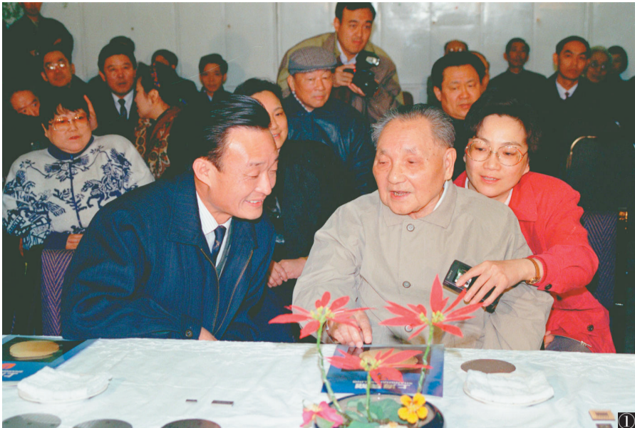
图①:1992年2月10日,邓小平同志在上海贝尔微电子制造有限公司参观时与吴邦国同志交谈。