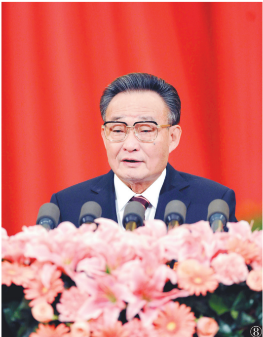
图⑧:2011年3月10日,十一届全国人大四次会议在北京人民大会堂举行第二次全体会议。吴邦国同志作全国人民代表大会常务委员会工作报告。