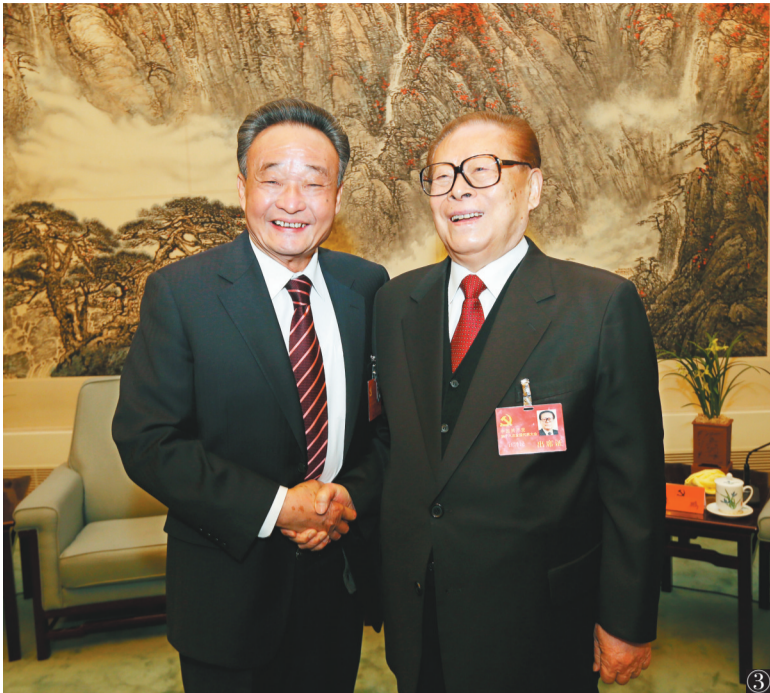
图③:2012年11月14日,中国共产党第十八次全国代表大会在北京闭幕。这是闭幕会前,江泽民同志与吴邦国同志在一起。