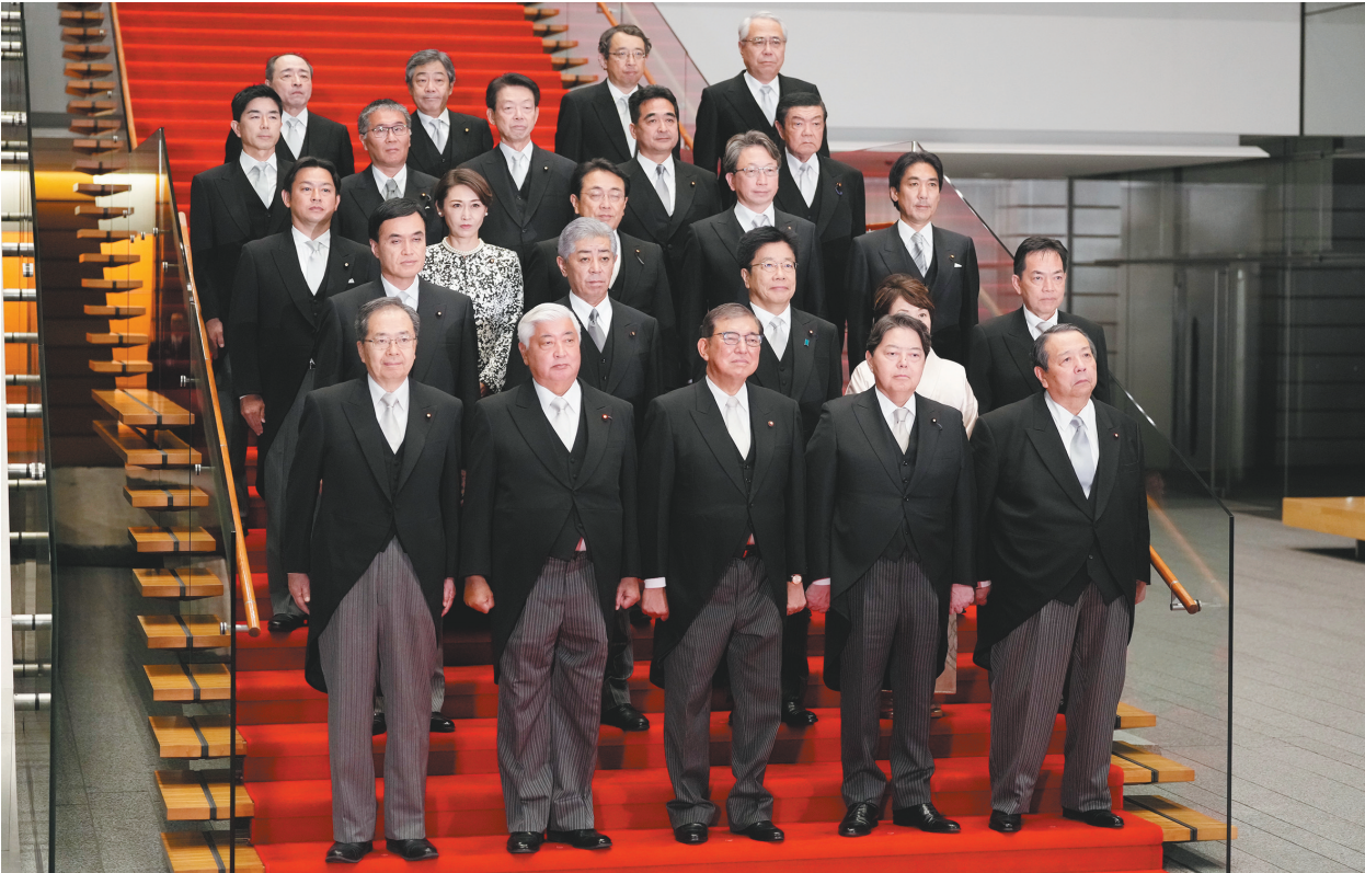
10月1日,日本首相石破茂(前排中)在东京的首相官邸率内阁合影。