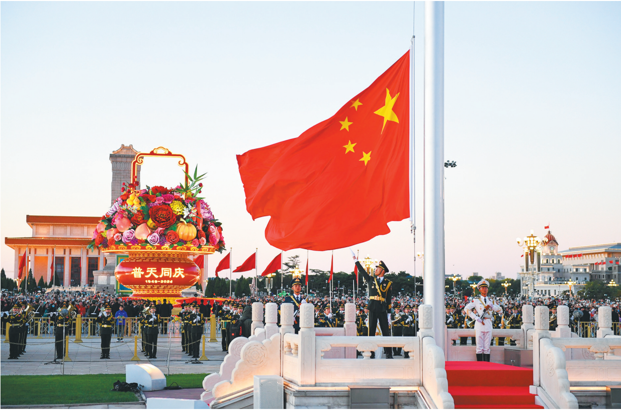
10月1日清晨,隆重的升国旗仪式在北京天安门广场举行,庆祝中华人民共和国成立75周年。

喜庆的中国,万千气象。 1日,北京中轴线上,南来北往的游客感受历史底蕴与时代荣光的交融。来自河南的周先生一家人来这里“打卡”。“行走在这条古老的中轴线上,我们更真切地体会到祖国的日新月异,更深刻地感受到中华儿女为强国建设、民族复兴迸发出的中国