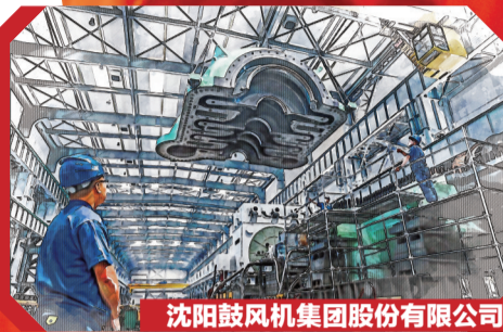
沈阳鼓风机集团股份有限公司