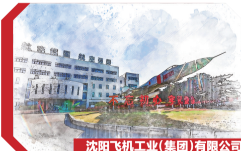
沈阳飞机工业(集团)有限公司