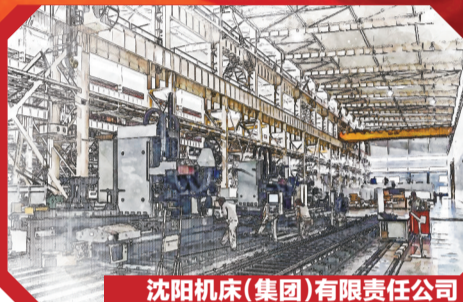
沈阳机床(集团)有限责任公司