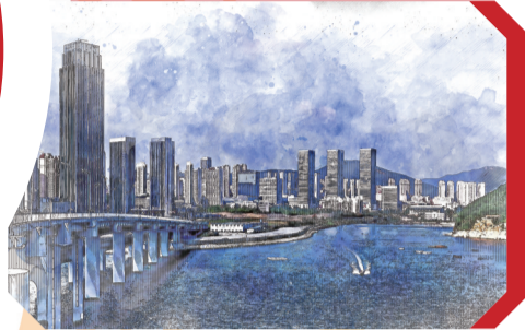
大连船舶重工集团海洋工程有限公司

高新区是科技的集聚地,也是创新的孵化器。看一个高新区是不是有竞争力、发展潜力大不大,关键是看能不能把“高”和“新”两篇文章做实做好。高新区要择优引入企业和项目,不能装进篮子都是“菜”。