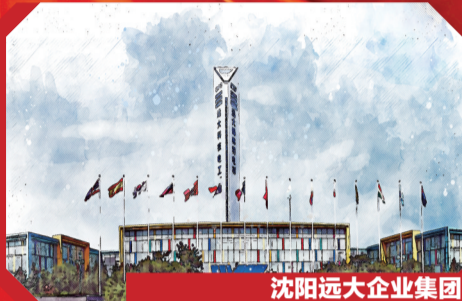
沈阳远大企业集团