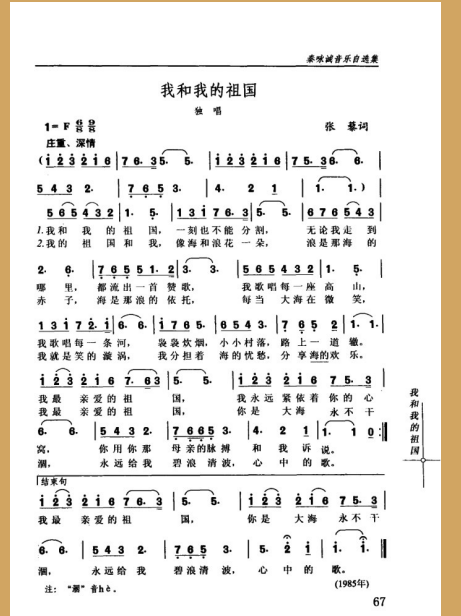
《我和我的祖国——秦咏诚音乐自选集（声乐篇）》（1995年出版）中收录的歌曲《我和我的祖国》。