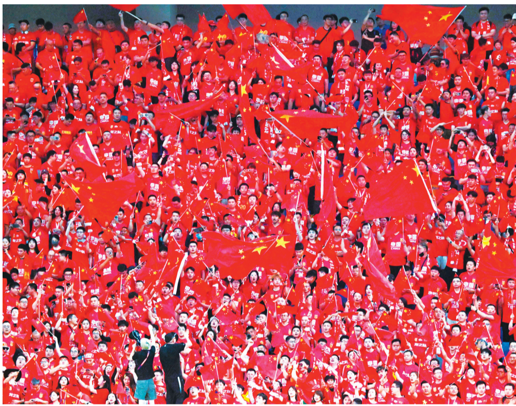
9月10日,来自全国各地的球迷在大连梭鱼湾足球场为国足加油。

知名解说员刘建宏在赛后表达了对国足的支持,他在视频中表示:“国家队和俱乐部不一样,作为一个球迷,如果你不支持国家队了,你会有种‘无家可归’的感觉。中国足球迷不会嫌弃中国国家队。”