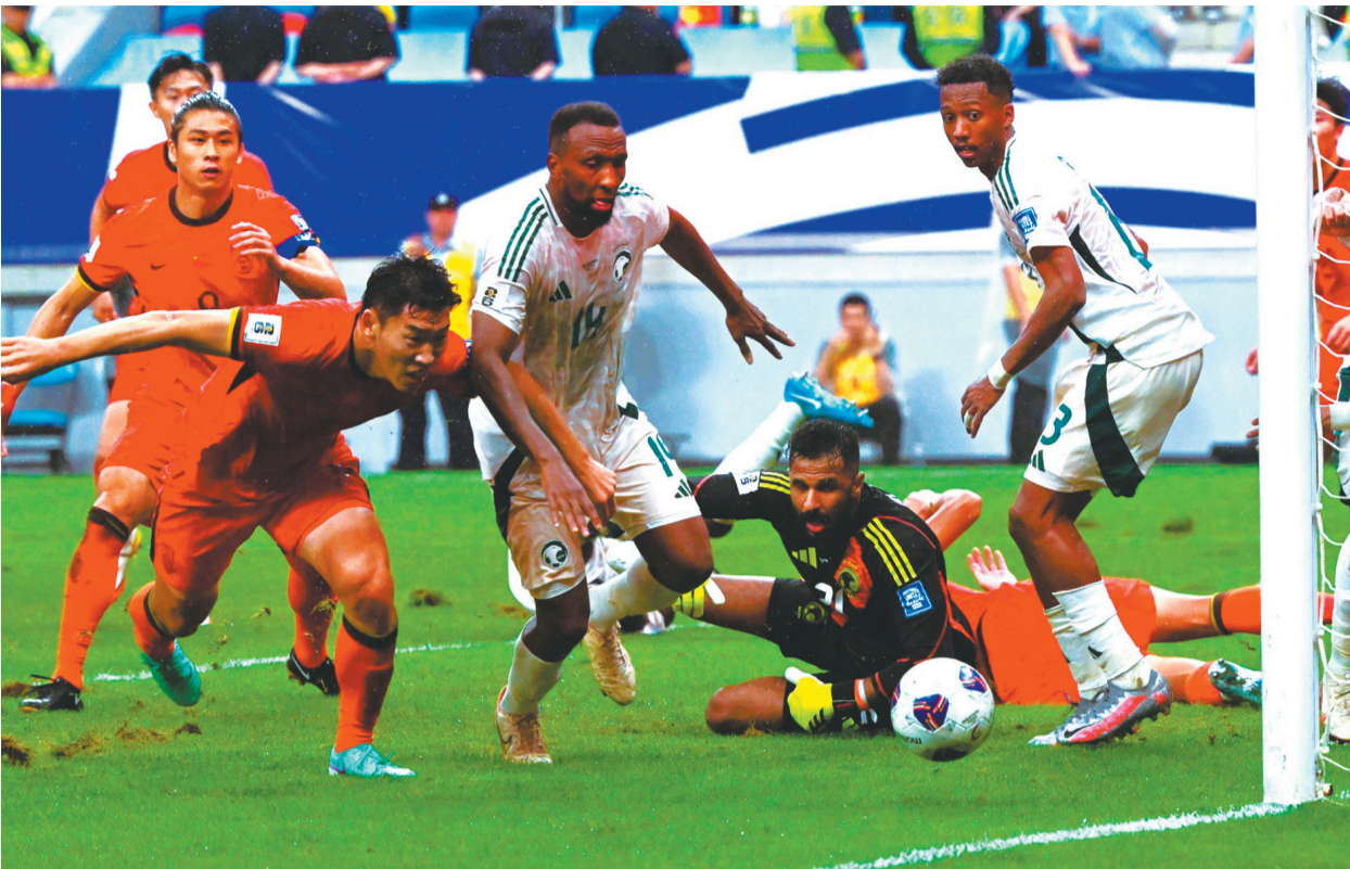
9月10日,国足球员(红色球衣)在沙特队球门前拼抢。

和进攻不力相比,国足在防守端的失误更加致命。首战日本队,国足的第一个丢球就是角球防守漏人,让对手舒舒服服地头球破门。本场比赛,国足又被同一块“石头”绊倒两次: