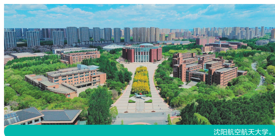
沈阳航空航天大学。

总之，必须深入学习领会习近平总书记关于教育家精神内涵实质的深刻阐释，并将其与教育实际工作结合起来，才能不断为强国建设与民族复兴伟业培养更多栋梁之才。