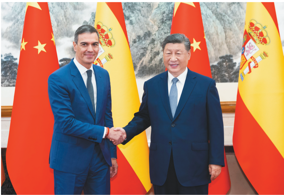
九月九日下午,国家主席习近平在北京钓鱼台国宾馆会见来华正式访问的西班牙首相桑切斯。