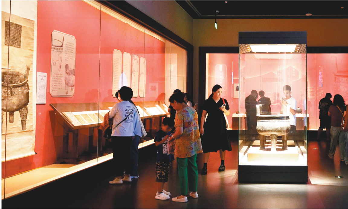
馆藏资源丰富的辽博每次推出新展,都会受到观众的热烈追捧。