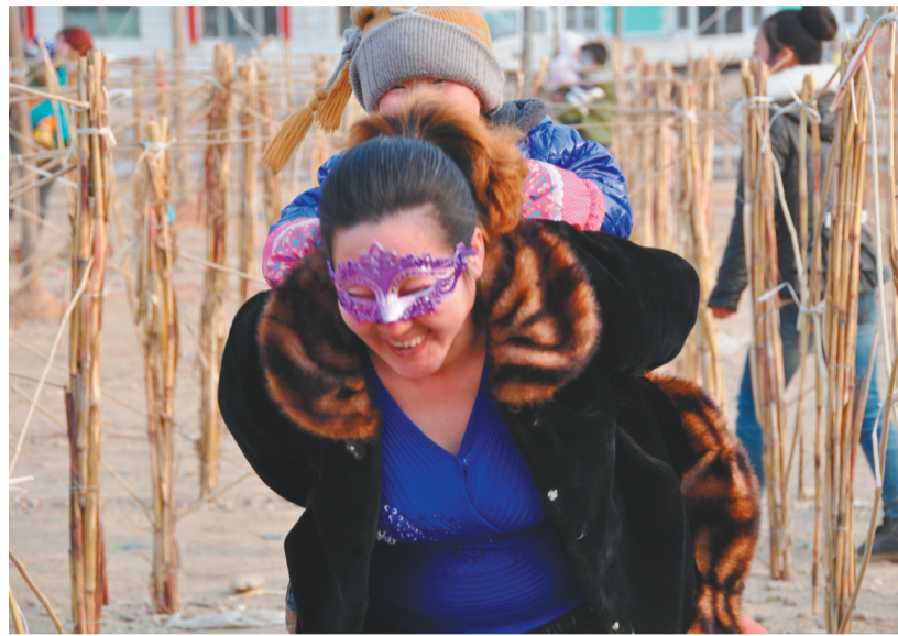
朱碌科镇一位母亲背着孩子欢乐“跑黄河”。

杨智宏告诉记者,黄河阵是小说《封神演义》中描写的阵法,是辽西民间传说的一部分,也是辽西民俗文化的重要组成部分。悠久的历史、深厚的内涵、百姓的喜悦,让建平县非遗工作者从2006年开始就关注并保护这一民俗活动。2021年,辽西朱碌科黄河阵被列入国家级非遗代表性项目名录。