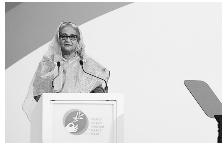
8月5日，孟加拉国总理谢赫·哈西娜辞职。这是2021年11月11日哈西娜在法国巴黎举行的巴黎和平论坛上致辞。

新华社达卡/新德里8月5日电（记者孙楠 伍岳）孟加拉国陆军参谋长韦克·乌兹·扎曼5日发表电视讲话说，该国总理谢赫·哈西娜当天辞职，将很快成立临时政府管理国家。