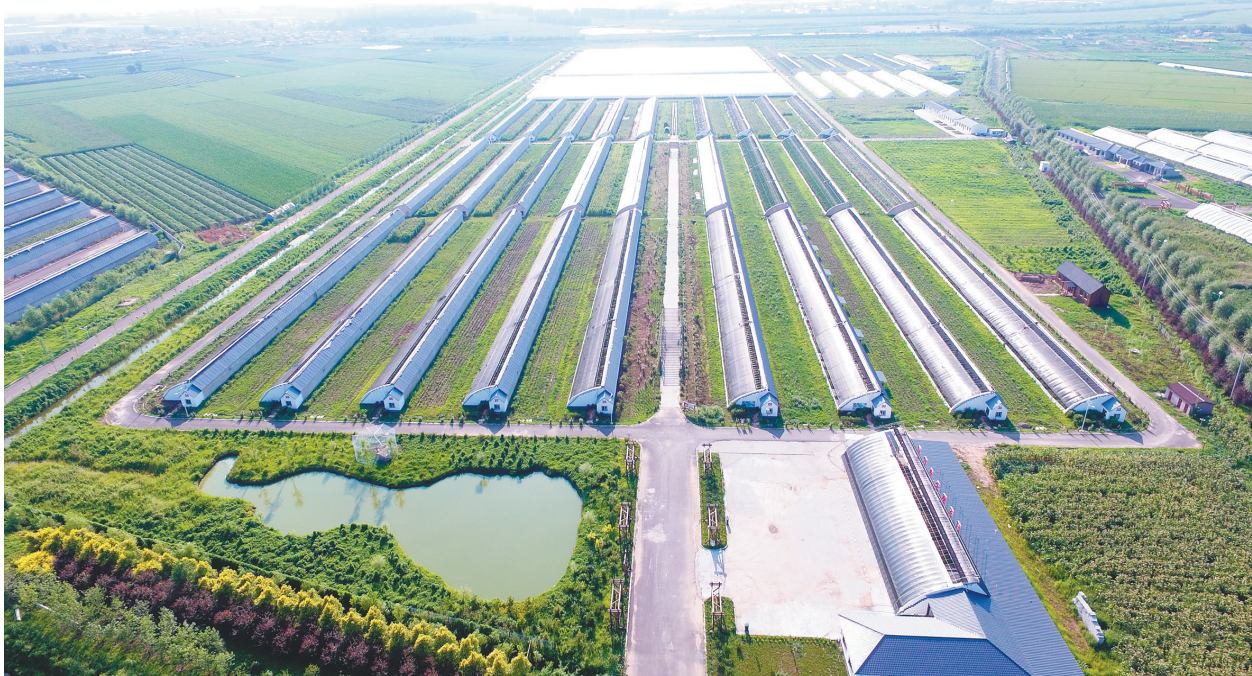
灯塔市“以点带线、以线扩面”不断推进乡村全面振兴。图为古城街道辽峰葡萄大棚。

拓宽基层治理覆盖面,铺就幸福底色。灯塔市坚持党建引领基层治理,建立县、乡、村三级调解机制,矛盾纠纷排查化解率实现100%;打造平安建设文化长廊18个,创建10个省市级“平安乡镇”“平安村(社区)”;推进“多网合一”融合治理,将全市193个村划分为1156个网格,配备村专职网格员193名,设立网格党支部4个,网格党小组729个,逐步推动治理精细化,构建和谐善治新格局。截至目前,灯塔市建成美丽乡村及升级版115个、美丽示范村36个、美丽宜居村37个,绘就乡村绿色宜居新画面。