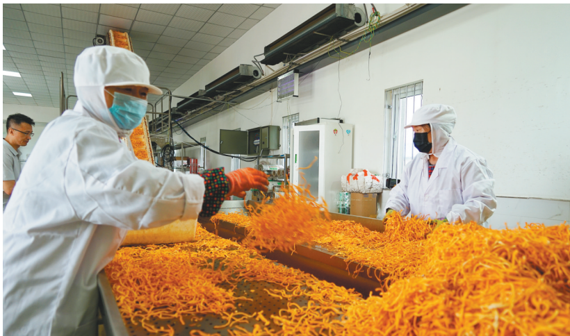
灯塔市以党建为引领,产业聚合发展,规模种植北虫草。图为灯塔市众信农业科技有限公司生产车间里,工人正在烘干北虫草。

服务融入“链”中,提质升级促发展。为切实把党的组织优势转化为推动乡村振兴的发展优势,帮助村民做好生产准备、渠道对接、水利、电力、运输等服务保障工作,产业联合党委成员单