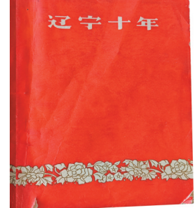
1960年出版的《辽宁十年》。