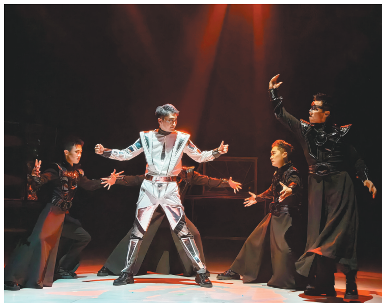
《拯救者·越域》让“移形换影”魔术呈现出了时尚前卫的表演形态。

技气息浓厚的未来世界,新材料、高科技芯片的使用更是催生了一批科技含量与艺术美感兼具的魔