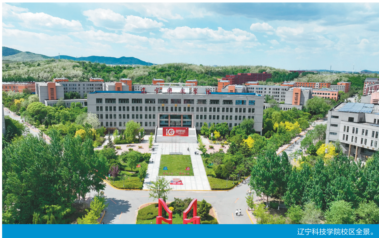
辽宁科技学院校区全景。

辽宁科技学院主动融入辽宁振兴发展，深化教育教学改革，先后成为辽宁省首批应用型转变的本科试点院校、教育部重点支持的产教融合项目建设高校、教育部数据中国“百校工程”试点院校、“互联网+中国制造2025”产教融合促进计划试点院校、辽宁省应用型转变示范院校、教育部首批新工科教育综合改革项目单位，获评全国五四红旗团委、辽宁省文明校园、辽宁省劳动教育示范学校、辽宁省高校院所知识产权运营中心建设试点单位。学校拥有智慧制造实验实训综合楼、辽宁科技学院数字化综合实训基地等平台，为持续推进产教融合，加速向应用型大学转变提供了强劲动力。