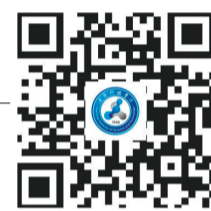
辽宁科技学院官方网站

联系电话：024-43164073 024-43164076(传真) 学校地址：辽宁省本溪高新技术产业开发区香槐路176号 学校网址：http://www.lnist.edu.cn