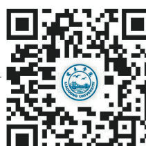
辽东学院官方网站