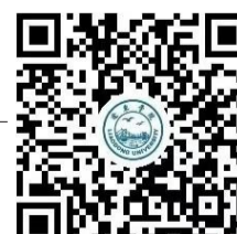
辽东学院智慧招生小程序

学校地址：(临江校区)辽宁省丹东市振兴区临江后街116号 (金山校区)辽宁省丹东市元宝区文化路325号 学校网址：www.liaodongu.edu.cn 联系电话：0415-3789102