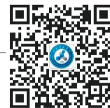
辽宁科技学院官方微信