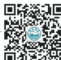
辽东学院微信公众号