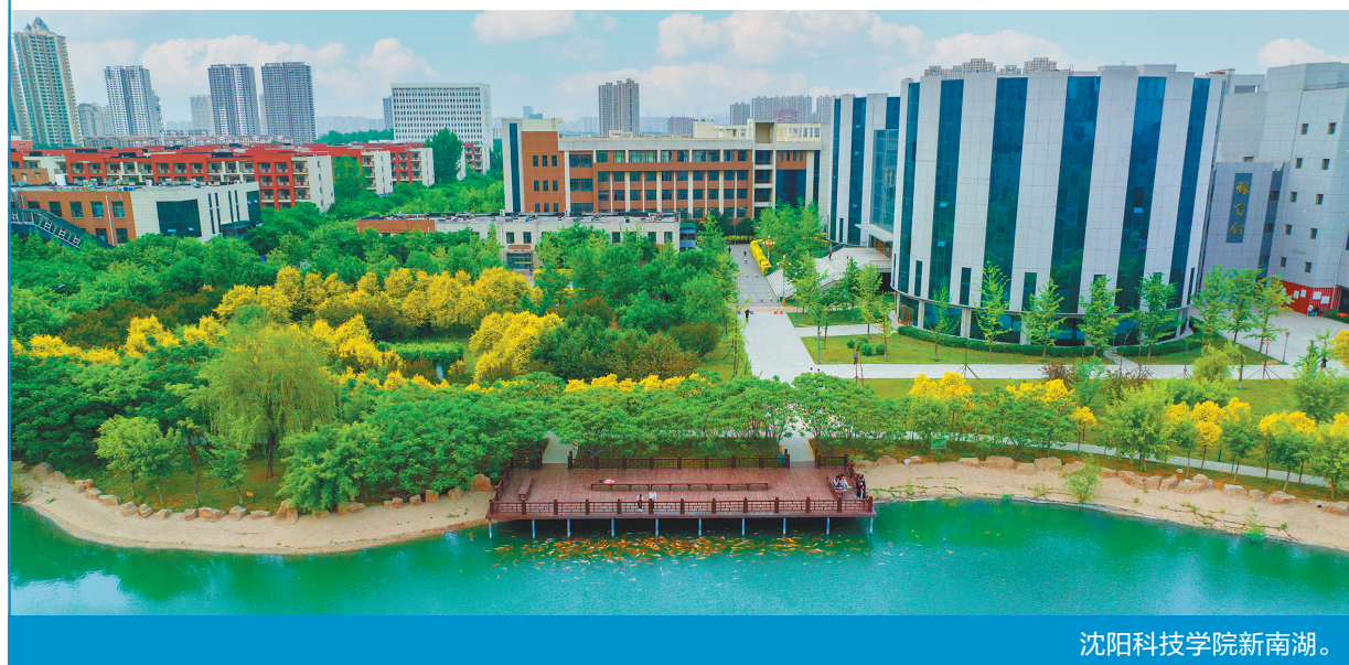
沈阳科技学院新南湖。