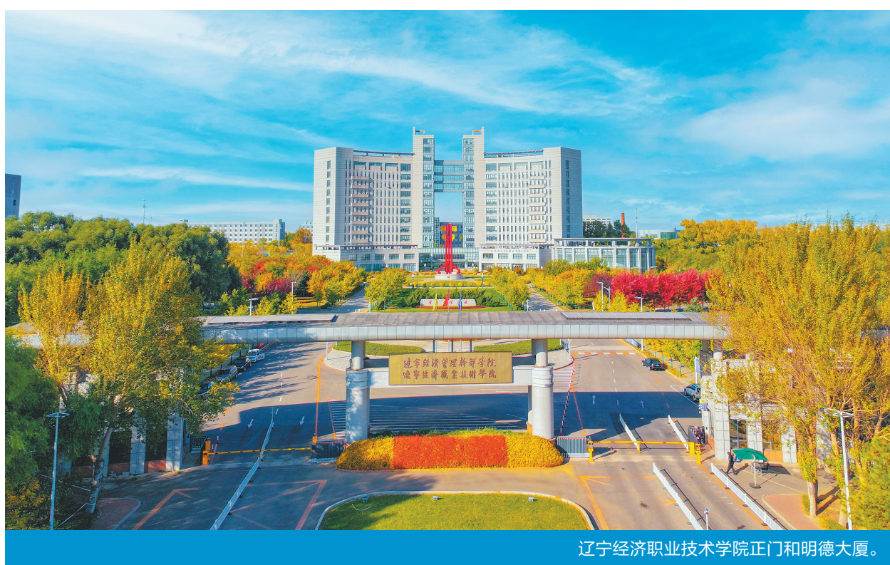
辽宁经济职业技术学院正门和明德大厦。

现有大数据财经、数字商贸、现代艺术设计、旅游康养、数字信息、科技服务6个专业群;国家级骨干专业5个,中央财政支持的重点建设专业2个,省级示范专业、品牌专业、高水平专业、卓越专业22个;高起点规划、高标准建设校内外实训基地300余个,中央财政支持重点实训基地2个。学院现有教职工516人,专任教师405人,副高级及以上职称教师174人(占比42%),博士及博士在读21人,硕士及以上学位354人,"双师型"教师占比91%以上,拥有国家级教学创新团队1个,辽宁省"百千万人才工程"百层次人才、省级专业带头人、省级教学名师、省级骨干教师59人。建校以来,累计培训各级各类学员12万余名,支撑国家战略和区域经济社会发展的能力持续增强。近年来,完