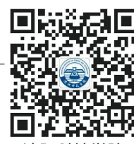
沈阳科技学院 微信公众号

■ 联系方式 学校地址:辽宁省沈阳市浑南区全运二西路30号 邮编:110167 招生热线:024-31679767 024-31969585 024-31679717 网址:www.syist.edu.cn 2024级新生QQ群:916440075