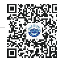
沈阳科技学院 招生咨询平台