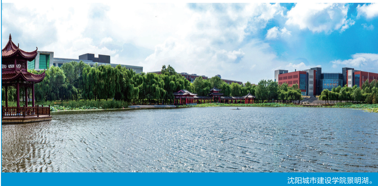
沈阳城市建设学院景明湖。