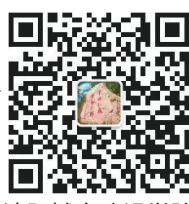
沈阳城市建设学院 招生服务在线

■ 联系方式 学校地址:辽宁省沈阳市浑南区全运五路501号 招生咨询电话:024-31679945 024-31679946 024-31679948 学校官网网址:www.syucu.edu.cn