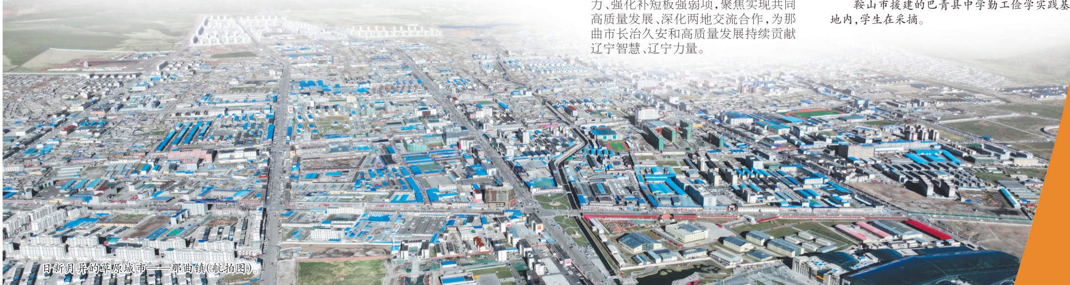
日新月异的那曲城市——那曲镇(航拍图)。