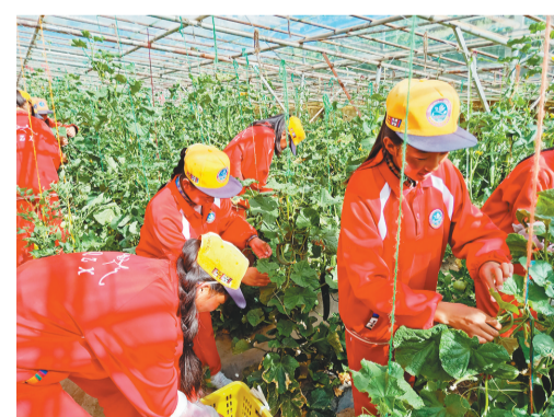
鞍山市援建的巴青县中学勤工俭学实践基地内,学生在采摘。