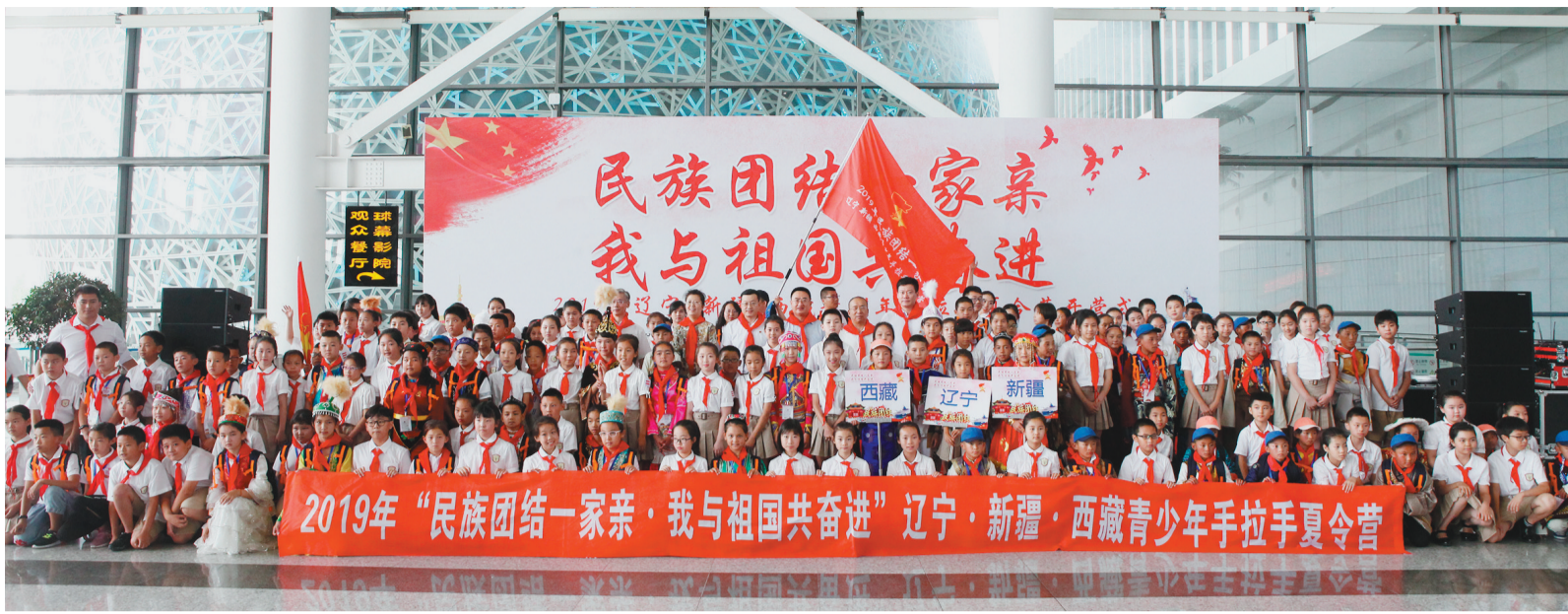
2019年“民族团结一家亲·我与祖国共奋进”辽宁·新疆·西藏青少年手拉手夏令营开营仪式现场。

辽宁,位于黄渤海之滨、辽河之畔;那曲,位于雪域之巅、大江之源。辽那两地,有四千海拔之落差,四千公里之路途。伴随藏北草原一年又一年牧草返绿,一批又一批辽宁省援藏工作队队员,肩负着中央的重托,肩负着藏北人民的期待,跨越万水千山,三十载接力前行,书写下“辽那一家亲,共谱山海情”的时代篇章。 对口援藏30年来,特别是党的十八大以来,辽宁援藏工作深入贯彻落实习近平总书记关于西藏工作的重要指示和新时代党的治藏方略,以铸牢中华民族共同体意识为主线,围绕干部人才交流合作、产业支援促进就业、保障和改善民生、民族交往交流交融、文化教育支援五方面重点任务,组织实施项目215个,保障和改善民生、惠及基层领域资金分别占比80.79%和85.86%,为推动那曲市长治久安和高质量发展贡献了辽宁力量。 辽那两地共同团结奋斗、共同繁荣发展,奋力绘就共同富裕美好生活新图景。