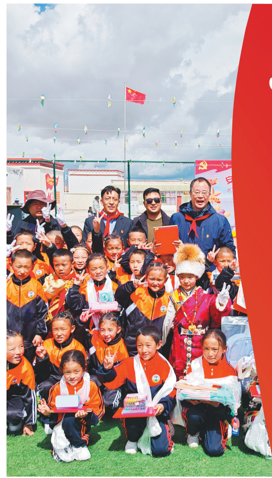
沈阳市第十批援藏工作队队员与安多县扎仁镇小学师生一起庆祝六一儿童节。