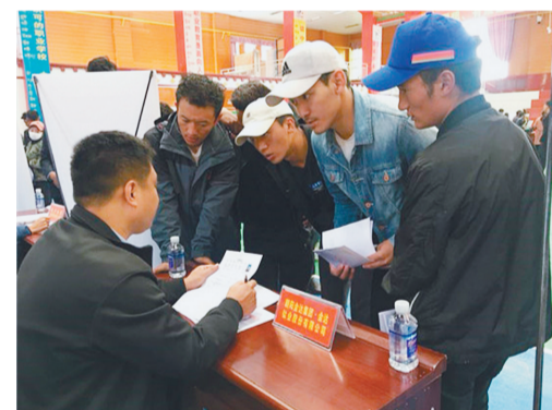
辽宁省就业援藏那曲高校毕业生专场招聘会现场。