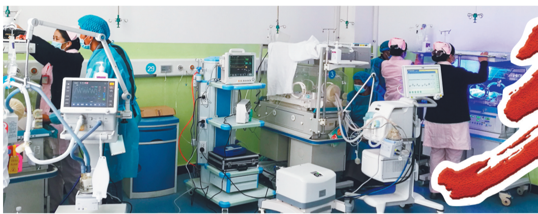
那曲市人民医院在援藏专家的支援下新成立了儿科ICU,使儿科成为藏北儿童危重症治疗中心。

辽宁援藏,突出面向基层、民生优先,聚焦群众关注的医疗、教育、养老等急难愁盼问题,把党的声音传递到广大牧民心坎上,让藏北农牧民群众切身感受到了党的关怀和温暖。