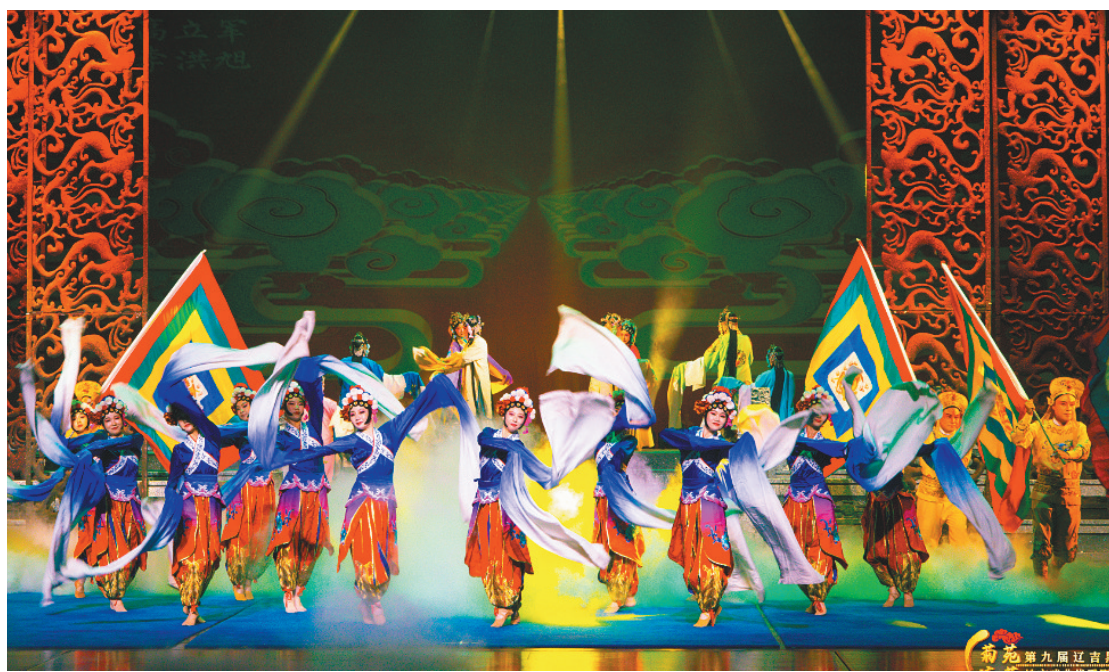
本次展演汇聚辽吉黑蒙10个戏曲剧种，让辽沈戏迷过足瘾。图为收尾曲的演出照。

大屏幕上铺开黑土地的壮阔画卷，青年演员们踏着欢快的旋律从观众席中走来，以朗朗上口、韵律十足的新说唱赞颂东北，这种新奇的亮相方式立刻引来如潮掌声。原创戏歌《欢迎您到东北来》以东北二人转、东北民歌、东北大秧歌为主基调，融入了演唱、说唱、舞蹈等多种表演形式。唱词集中描绘了东北的优美生态和丰富人文，“来到东北不用问，小鸡蘑菇就是炖，棒打狍子瓢舀鱼，野鸡飞到饭锅里……”满满的东北味道，让人身临其境。戏中有歌，歌中有戏，使戏曲艺术与新时代