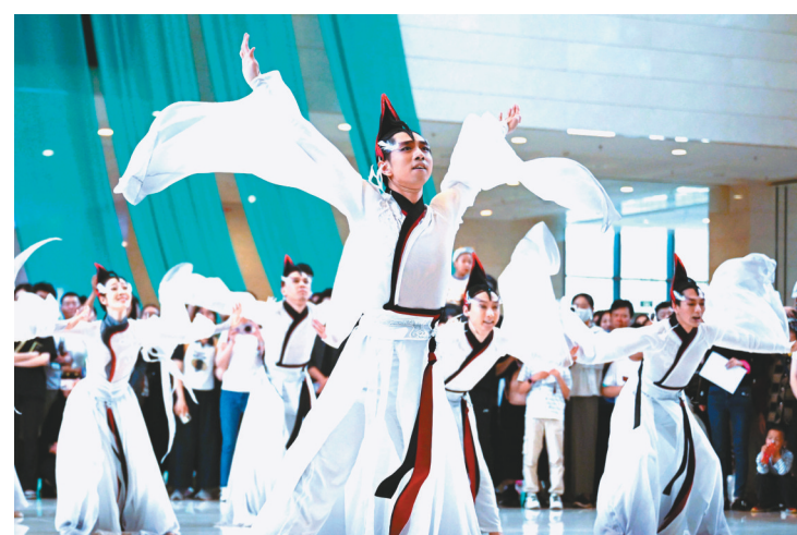
“瑞鹤篇”舞蹈快闪活动让传世名画“动”起来。

“《瑞鹤图》创作于公元1112年，作者是宋徽宗赵佶。那一年的正月十六，他在端门参加活动，突然天空中出现群鹤，他认为这代表了祥瑞，就画了下来。”辽博副馆长董宝厚介绍，《瑞鹤图》表现了群鹤翻飞的百变姿态，画面构图、色彩与技法精妙绝伦。“如何用创造性转化、创新性发展的方式，让《瑞鹤图》与观众产生更多的互动，是我们一直思考的问题。这次以舞蹈的形式还原了《瑞鹤图》的神韵，相