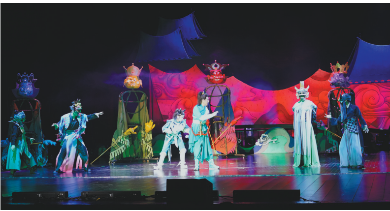
儿童剧《封神之二郎神》用“传统+现代”的戏剧舞台语言为小观众展现了二郎神大战魔家四将、斩蛟龙、劈山救母等经典故事。

三尖两刃戟,披荆斩恶蛟……6月1日,辽宁儿童艺术剧院全新创作的儿童剧《封神之二郎神》在沈阳中华剧场首演,亮相辽宁省第三届“大河之澜”演出季。