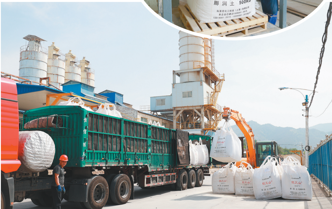
科莱恩红山膨润土(辽宁)有限公司产品灌装及运输中。