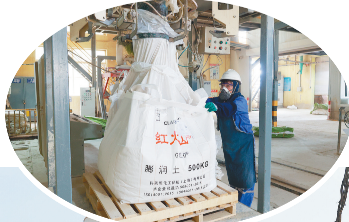
科莱恩红山膨润土(辽宁)有限公司产品灌装及运输中。

智能化改造,企业生产线实行封闭式生产方式,不仅控制了粉尘污染,改善了生产环境,还达到了工艺创新、技术创新、智能数控、绿色环保的效果,企业屡屡登上省级数字化赋能企业、省级