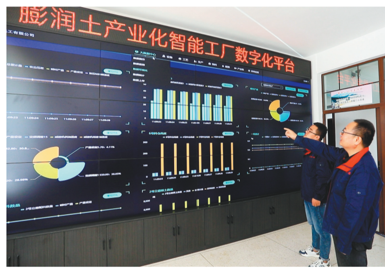
智能数字化平台助推辽宁地恩瑞科技有限公司生产发展。

畅通政企交流“直通车”。不断提升12345平台涉企案件处理质效,对各类涉企问题线索甄别核