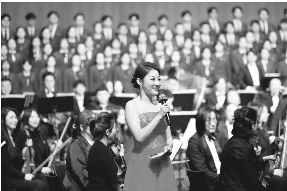
12月25日,大连艺术学院新年音乐会上,《白毛女组曲》《红色娘子军组曲》等经典作品再次奏响。

尤为让人欣喜的是,票价惠民力度的加大、惠民卡兑换政策的便利、低价位场次的增多使得百姓有了亲近高雅艺术的更多机会,营造了全民同庆、人人共享的艺术氛围。对于广大音乐爱好者以及渴望用一场仪式感满满的音乐会高高兴兴跨年的观众来说,今年的选择更多,文化获得感和幸福感更强。