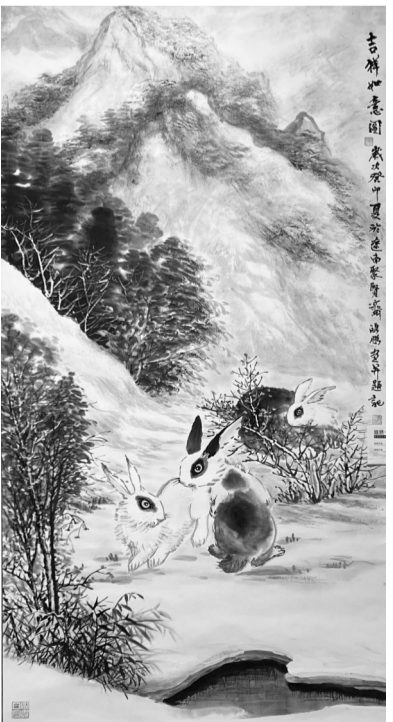
《吉祥如意图》 吴鸿鹏 作

如王政佳的《银雪霜凌》,白云紫黛,雪山巍峨,着力表现了北方雪景山水的大气和苍茫。远山雾气以衬雪山之高,山脚点缀雪屋以示雪山之阔。无论是对近处树木的细描,还是对群山的塑造,作者都是在运用留白法描绘雪景山水,颇具东方山水意境。而张成思的《瑞雪》、张雨