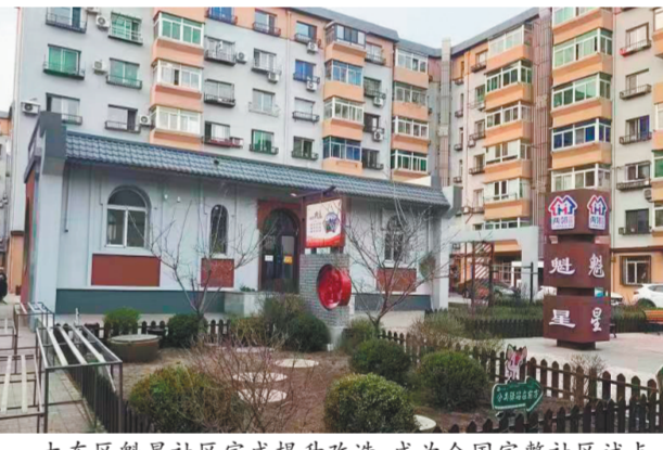
大东区魁星社区完成提升改造，成为全国完整社区试点。