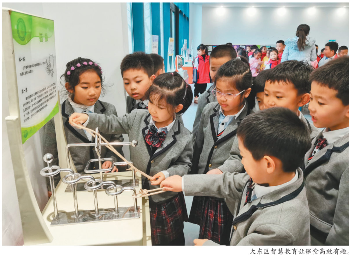
大东区智慧教育让课堂高效有趣。