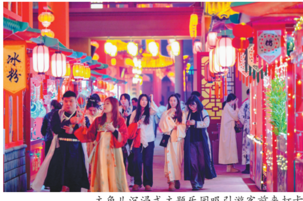
主角儿沉浸式主题乐园吸引游客前来打卡。