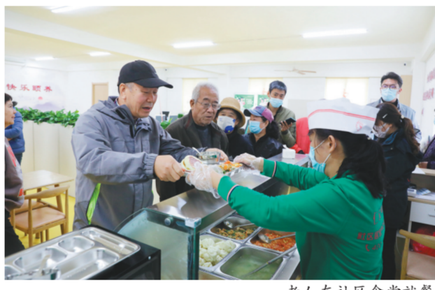
老人在社区食堂就餐。