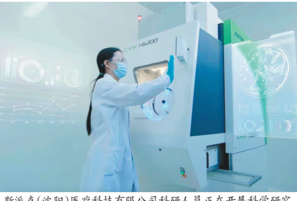
斯派克(沈阳)医疗科技有限公司科研人员正在开展科学研究。