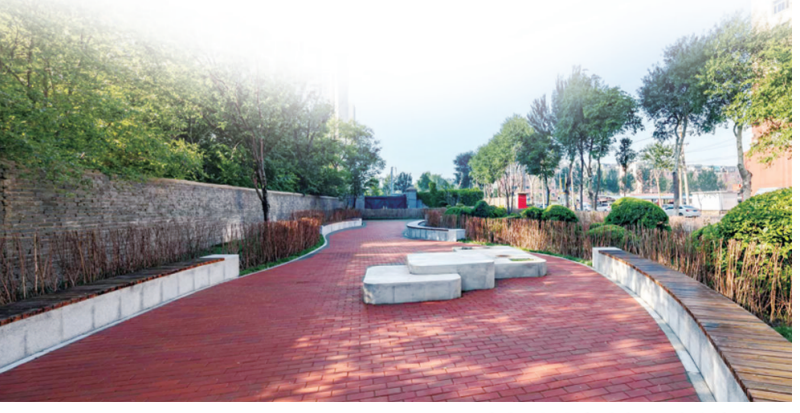
本版稿件由本报记者刘桐采写

坚持党建引领，践行“两个”理念，深入开展携手共建更加幸福美好家园专项行动，扎实开展“激浊扬清”温暖行动和“激浊扬清”志愿服务。