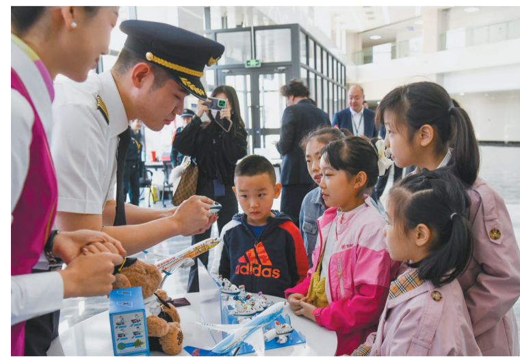
10月22日,在位于乌鲁木齐的南航新疆空勤训练中心,小朋友观看南航文创产品。当日,在南航新疆空勤训练中心开展的媒体公众开放日活动中,小朋友近距离体验飞行员、乘务员等在应急生存、客舱模拟操练等方面的日常训练内容。