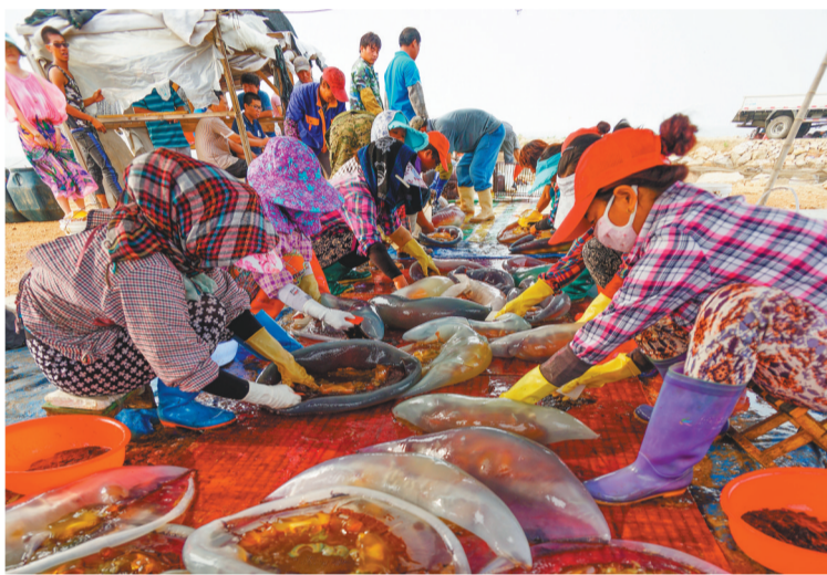
渔民们在处理刚刚打捞上岸的海蜇。

营口海蜇不仅产量可观,而且以肉质饱满、营养丰富、品质上乘闻名海内外。近年来,营口市经历了从海蜇捕捞到养殖和精深加工的华丽转型,是我国最大的海蜇养殖、加工和贸易集散地,是名副其实的“中国海蜇之乡”。