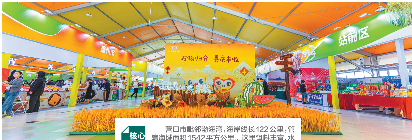
2023第六届中国(营口)海蜇节展会现场。