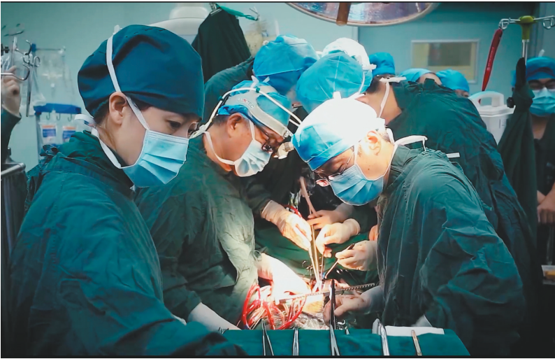
中国医大一院专家团队在为患者进行手术。

今年8月19日是第六个中国医师节,也是党的二十大召开后的首个中国医师节,主题是“勇担健康使命,铸就时代新功”。人民健康是民族昌盛和国家强盛的重要标志。党的二十大报告对推进健康中国建设作出重要部署,提出“把保障人民健康放在优先发展的战略位置”。我省全力推进健康辽宁建设,将之作为保障和改善民生的重要内容,纳入辽宁全面振兴新突破三年行动。全省广大医师坚守“敬佑生命、救死扶伤、甘于奉献、大爱无疆”的崇高职业精神,在岗位上崇尚医德、钻研医术、秉持医风、勇担重任,不断增强人民群众就医获得感。