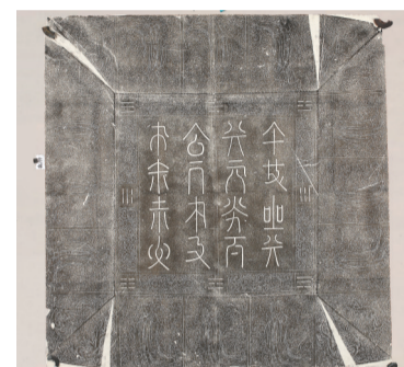
辽道宗宣懿皇后契丹文哀册并盖的字体充分体现了民族融合。