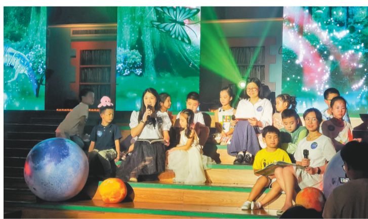
7月22日,来自沈阳、辽阳等地的200多名读者参加了省图“奇妙夜”亲子阅读活动。

“今晚,各位小朋友、带着你们家的大朋友,来我的家里做客。”省图少儿卡通形象小章鱼走上“奇妙