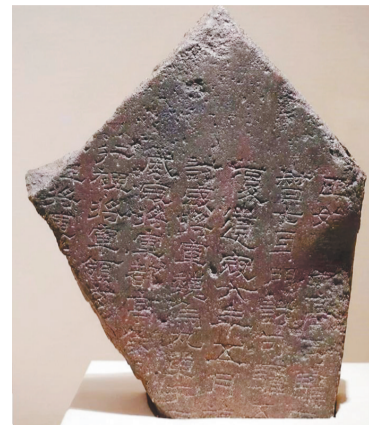
三国毌丘俭纪功残碑是目前东北地区发现最早的石刻文献资料。

据悉,《第一批古代名碑名刻文物名录》包含碑刻、摩崖石刻等1658通(方)重要文物,刻成年代从战国至清,文字种类包含汉文、藏文、蒙文、满文、维吾尔文等20种,全国31个省、自治区、直辖市均有分布,保管、收藏在323处文物保护单位 and 221家文物收藏单位。