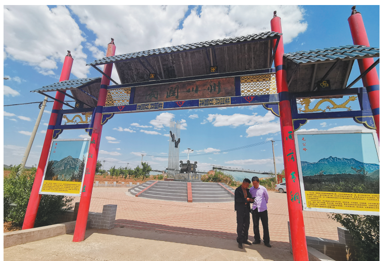
青铜雨广场如今已成为北票大营子村村民休闲活动的场所。

2016年,根据散文《青铜雨》建设的同名广场正式在大营子村落成。对雨的共同期盼和赞颂,让文字与广场在这片土地上同时落地。大营子村,这个偏居一隅的“三燕”王朝旧地,也由此诞生了国内第一座以雨为主题的广场。