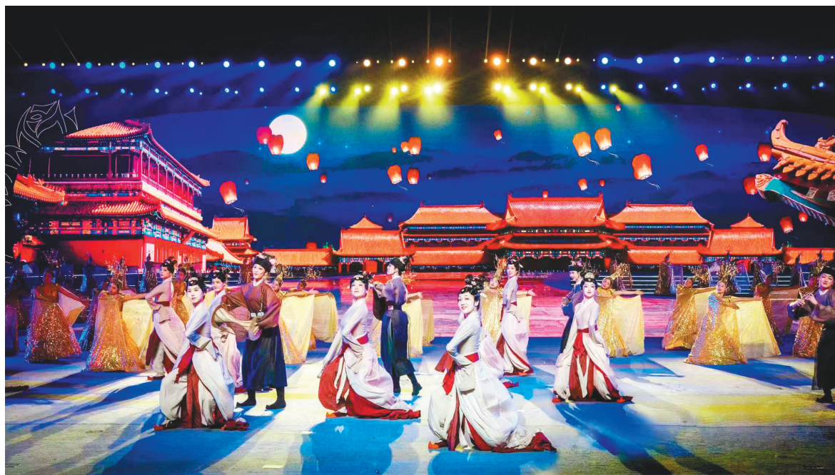
开幕式上,沈阳音乐学院表演的古典舞《散乐图》成为一大亮点。

“新中国第一桶油、第一吨钢、第一台机床、第一架喷气式飞机、第一艘万吨轮船……辽宁创造了1000多项全国‘第一’。辽宁是