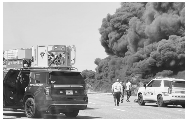
4月21日,美国康涅狄格州的公路桥起火现场浓烟滚滚。一辆油罐车与一辆小汽车21日在美国东北部康涅狄格州一条主要公路桥上相撞,引发大火,道路一度关闭。