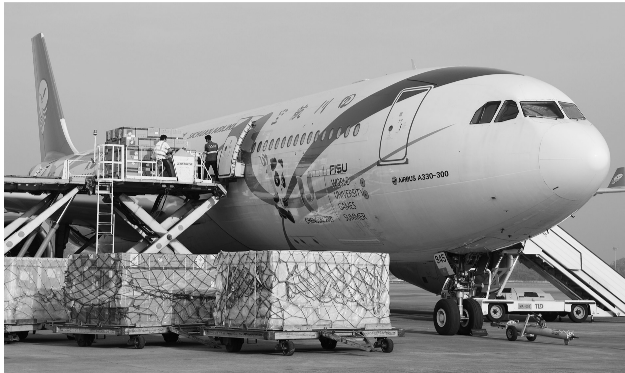
这是2023年1月19日在缅甸仰光国际机场拍摄的中国政府援助缅甸的新冠疫苗。

着眼共同命运,洞察时代大势。中国的安全理念和主张不断发展丰富。今年2月,中国发布《全球安全倡议概念文件》,阐释倡议的核心理念和原则,明确重点合作方向和平台机制。文件列出20项重点合作方向,具有鲜明的行动导向,归纳起来就是:坚定支持联合国安全治理核心作用、努