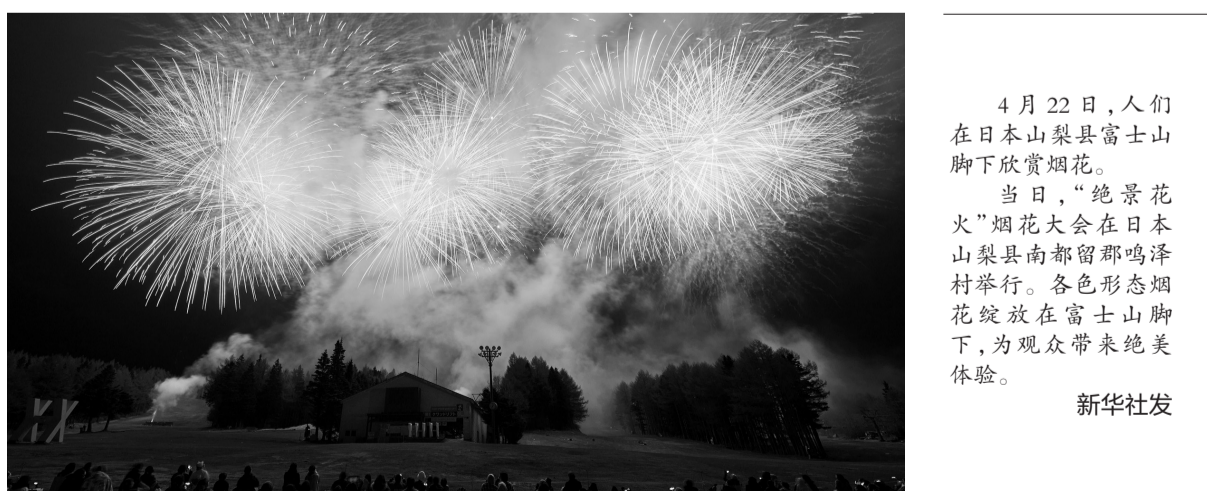
4月22日,人们在日本山梨县富士山脚下欣赏烟花。

当日,“绝景花火”烟花大会在日本山梨县南都留郡鸣泽村举行。各色形态烟花绽放于富士山脚下,为观众带来绝美体验。