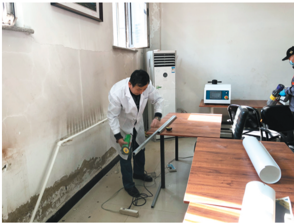
保护修复实验室已搭建完成。

要的作用。由于地域、民族、兵种和等级不同,同为甲冑,却有很多差别。古代甲冑品类繁多,制作工艺涉及面广,是古代战争史、科技史、考古学、文物学等学术研究不可缺少的一项内容。历史上保存下来的甲冑实物,尤其是年代久远的甲冑,少之又少,一般只能从地下埋藏的遗存中偶有获得,因此非常珍贵。