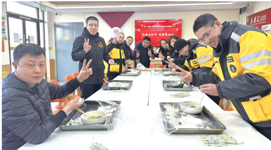
专业社工组织春节关爱活动

以党建引领为核心，以专业社工为“智囊团”精准对接需求，以新就业群体为“生力军”主动反哺社区，以“樾檀山社区微光志愿服务驿站”为纽带、“点单—派单—接单”为机制，构建“服务新就业群体—激发志愿活力—提升治理效能”的双向赋能体系，让新建社区从“邻里陌生”变“亲如一家”。