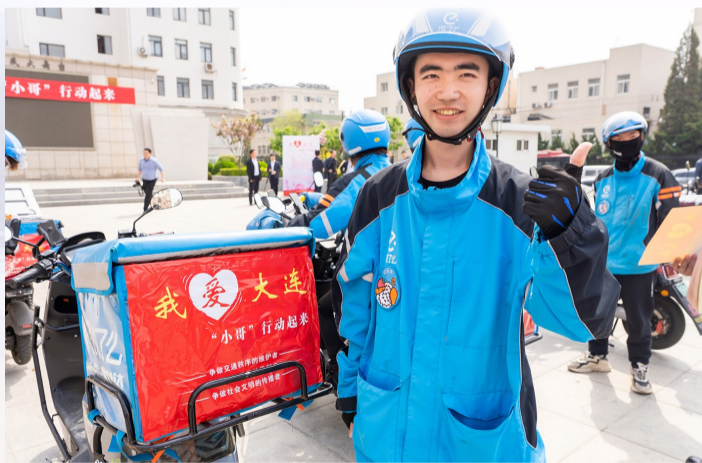
饿了么网约配送员代表参加“我爱大连,‘小哥’行动起来”活动启动仪式。

大众一汽发动机(大连)有限公司党委在这一体系下创新“116X”党建模式,198名党员带动超过88%的员工提交900条建议,推动企业年节约成本超727万元。