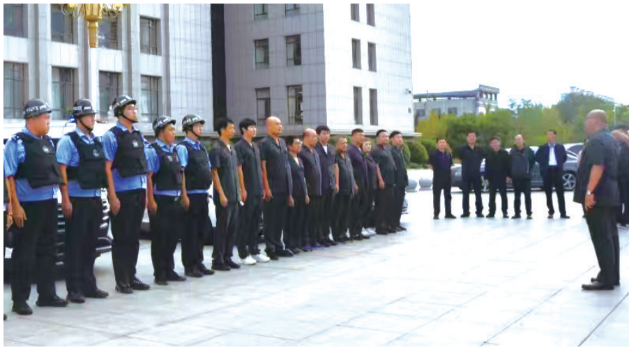
北镇市人民法院开展执行“秋风行动”,出发前院领导进行动员讲话。

“执行‘110’实行执行干警轮班制度,申请执行人及社会公众如发现被执行人财产线索、被执行人下落或需要采取司法拘留措施的被执行人踪迹线索及执行突发情