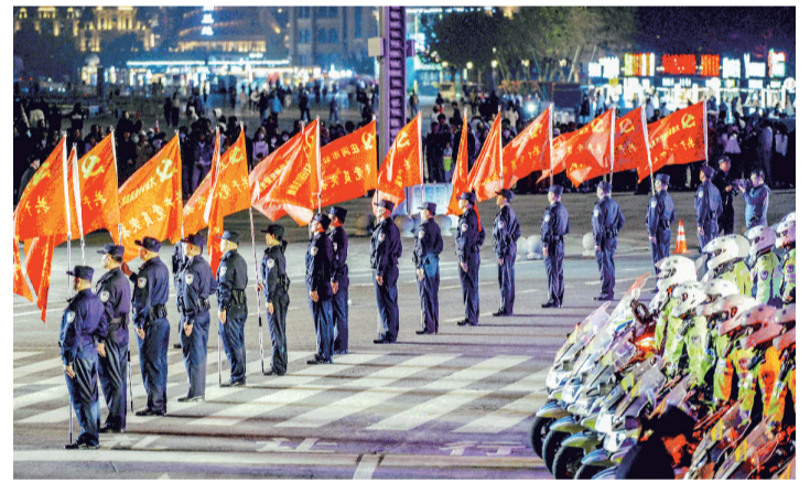
16支党员突击队方队蓄势待发