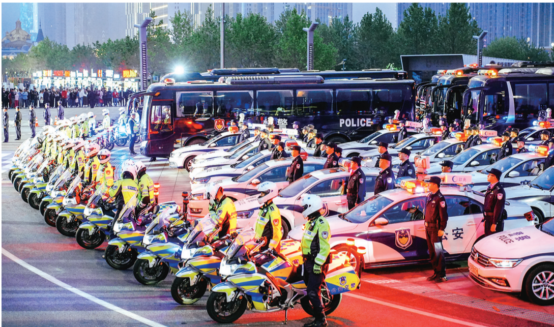
集结的队伍准备奔赴巡查宣防的各个“战场”

活动现场,与会领导为16支党员突击队代表授旗。接旗手们胸前佩戴着红色的党徽,面向红色的党旗,郑重接旗。鲜艳的党旗迎风飘扬,汇聚成一片红色的海洋,忠诚之师激荡的信念格外闪耀!